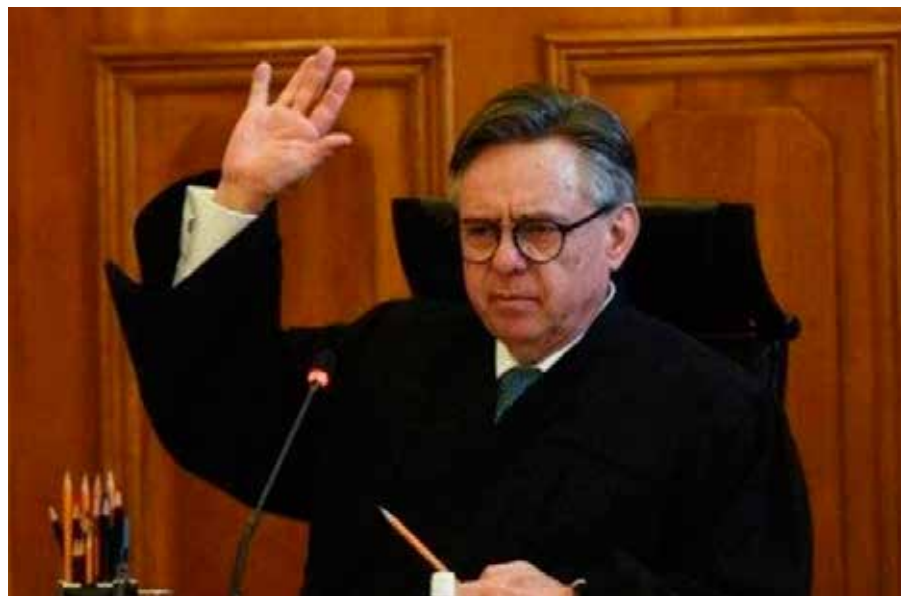
Eduardo Medina Mora, ministro de la Suprema Corte de Justicia.

de que concluya el periodo para el que fue electo, en un contexto de investigaciones que realiza la Unidad de Inteligencia Financiera de la Secretaría de Hacienda sobre sus cuentas y manejos financieros de los últimos años, en las que según información que recibió el gobierno mexicano de agencias financieras del Gobierno de los Estados Unidos, el funcionario judicial recibió transferencias que no corresponden con los niveles de ingreso reportadas en sus declaraciones patrimoniales. Un asunto que se pone al rojo vivo y que seguramente dará mucho de qué hablar. R