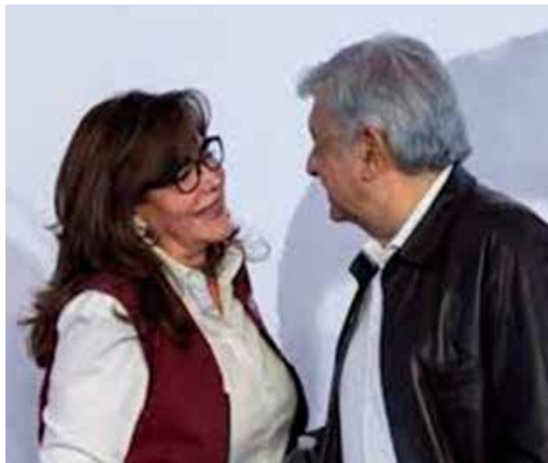
Yeidckol Polevnsky, presidenta nacional de Morena y el presidente AMLO.

- ¿Qué tan cercana es Ana Gabriela Guevara? – preguntó el político – Ella igual apareció en la lista, y alegó lo