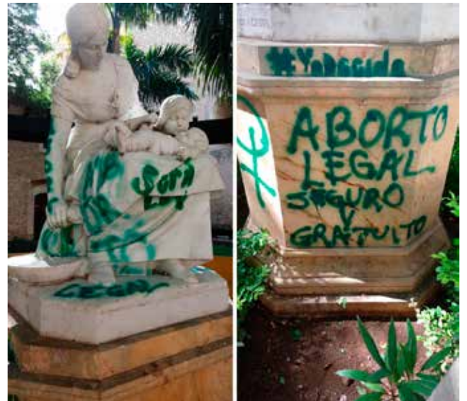
El monumento a La Maternidad, que da nombre al Parque de la Madre y que fue estropeado por un grupo de vándalos, es una reproducción en mármol del original ubicado en París, y es obra del escultor Alfred Lenoir. Fue donado a la ciudad de Mérida por la Liga de Acción Social y data del 12 de octubre de 1928.

- Este es uno de los principales problemas de la actualidad, la gente piensa que al salir a manifestarse se le justifica causar disturbios. Por ejemplo, como bien sabrán, estas movilizaciones se replicaron en algunas ciudades del país, y una de ellas fue Mérida. Tras la manifestación, los yucatecos reprochamos los daños ocasionados a nuestro Monumento a la Madre por parte de las manifestantes a