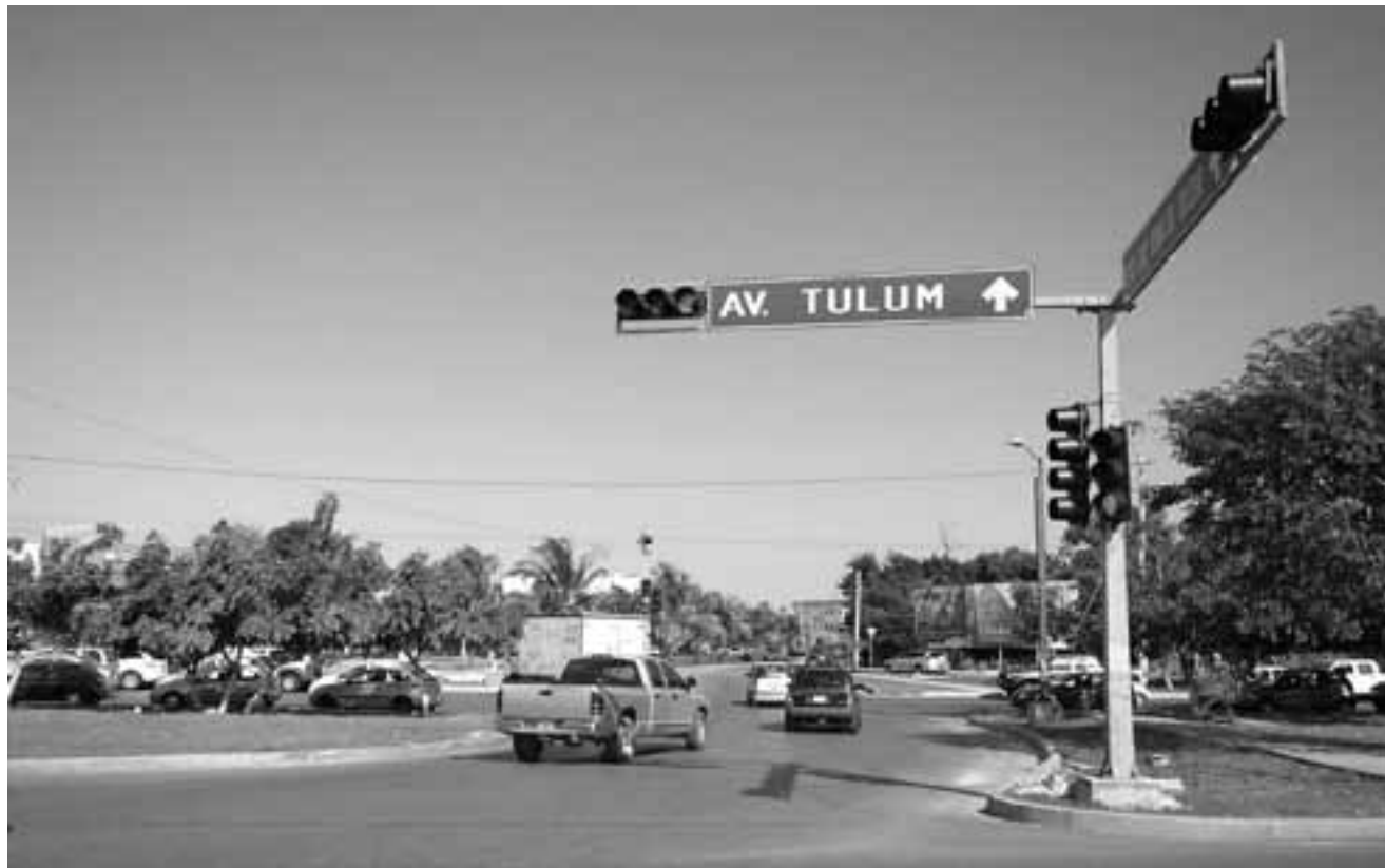
Con la división de la izquierda, al menos en Quintana Roo y particularmente en Cancún, quien heredó la militancia fue Morena.

el norte, mientras que el PAN y el PRD lo hacen en el sur, el promedio general le da al PRI una supremacía materialmente imposible de vencer.