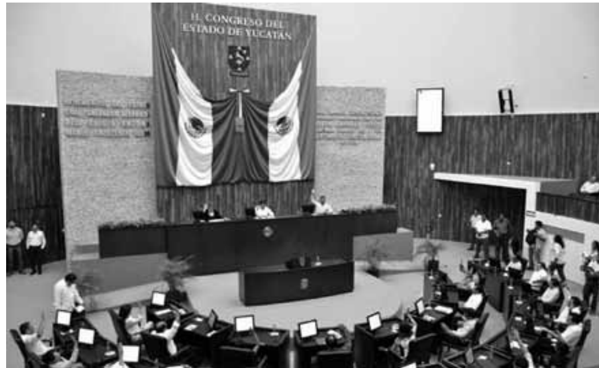
El PRI necesita 17 votos en el Congreso local para aprobar todas las reformas presentadas por el Ejecutivo estatal sobre seguridad.