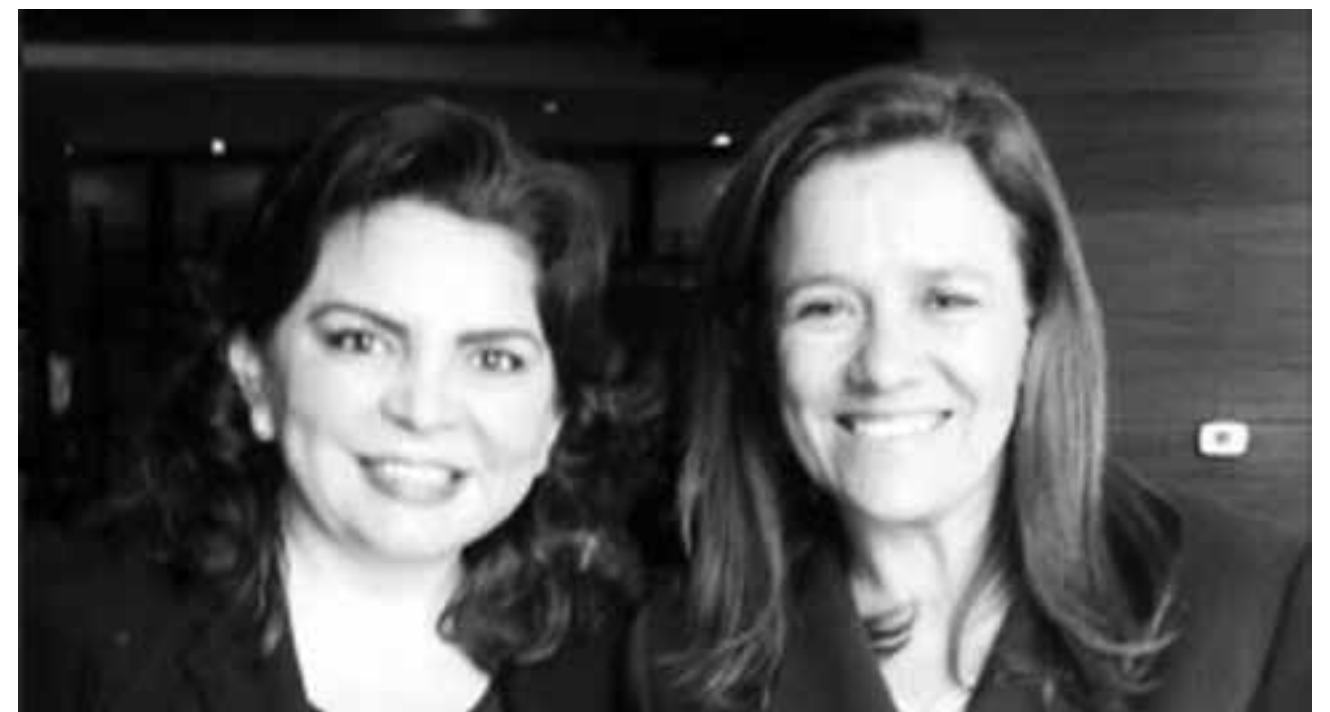
La legisladora federal Ivonne Ortega Pacheco coincidió en un evento con Margarita Zavala, con quien se tomó la foto del recuerdo.

De esto y más estaremos pendientes. Recibimos correos con firmas en yazrodriguezg@gmail.com R