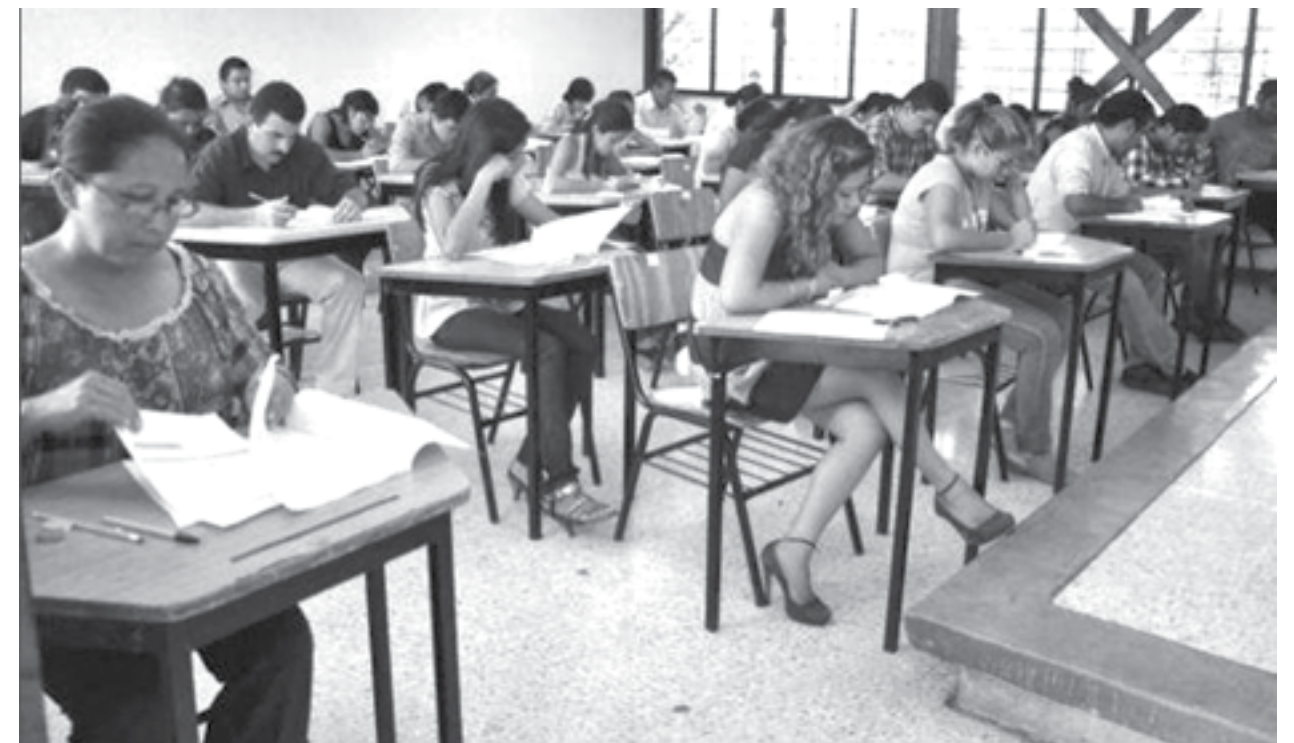
Yucatán fue el único estado con 100% de participación y cumplimiento en la evaluación magisterial, en la que 9 de cada 10 docentes fueron evaluados obtuvieron resultados positivos.

-Soy institucional, donde le pueda servir a mi partido ahí estaré, pero lo primero es trabajar y responder a lo que te piden, esa es la mejor carta de presentación. IR►