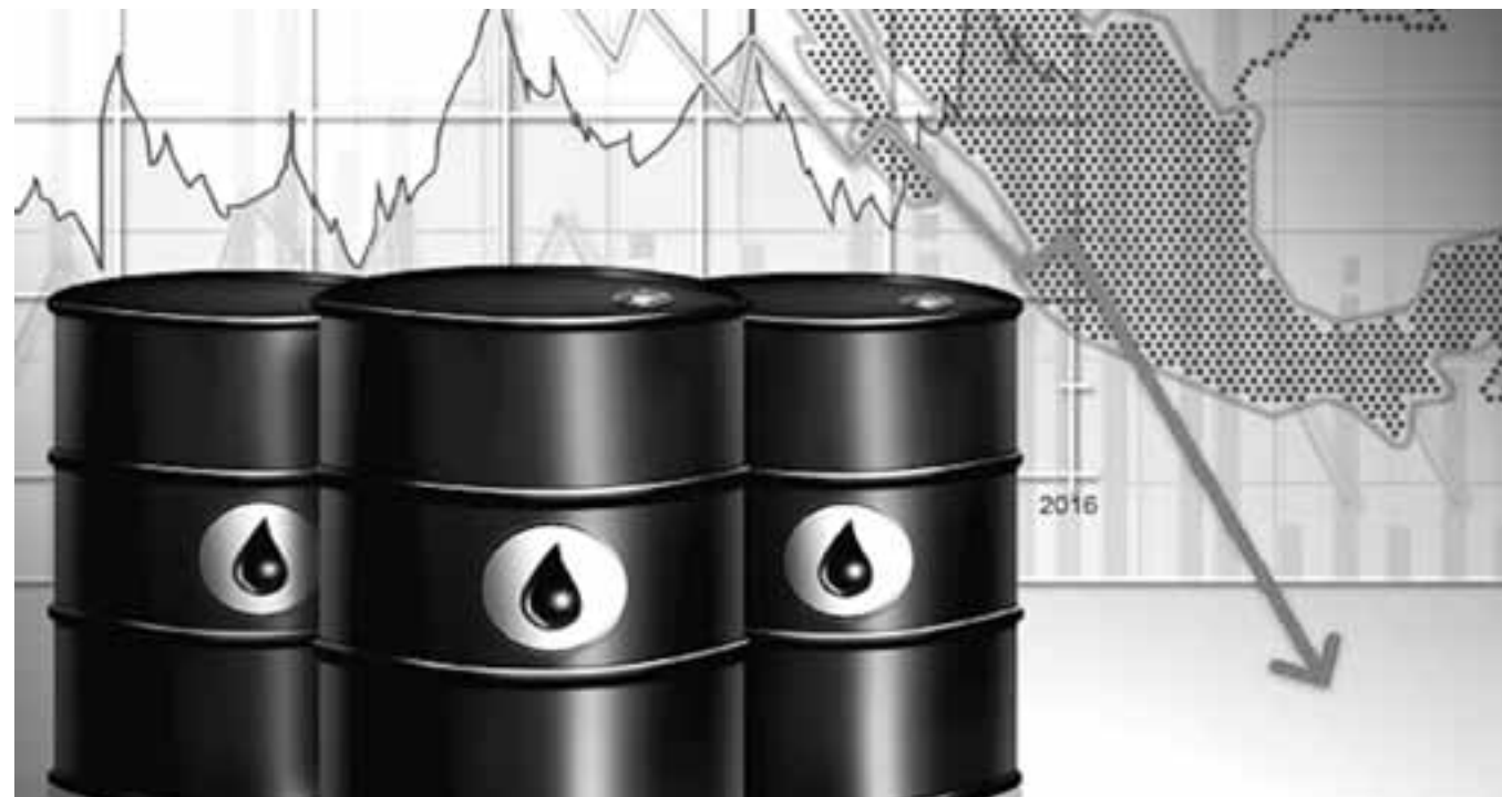
Durante casi dos años el gobierno estuvo a la deriva en espera del encendido del motor de la economía mundial para las reformas, pero el tiempo se agota. El débil crecimiento y la caída del petróleo serán duraderos.

Durante casi dos años el gobierno estuvo a la deriva en espera del encendido del motor de la economía mundial para las reformas, pero el tiempo se agota. El débil crecimiento y la caída del petróleo serán duraderos. Ello favorece los viejos reflejos de encierro y dar la espalda a la valoración del país en el mundo. El cambio de señales se lee en la decisión de pagar los costos de la confrontación con