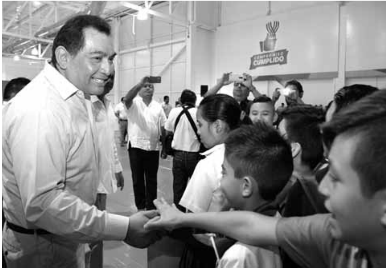
"La mejor recompensa al trabajo bien hecho es la oportunidad de desempeñar más trabajo, porque eso implica que se han cosechado buenos resultados".

titucional. Ha sido catedrático universitario durante más de 10 años.