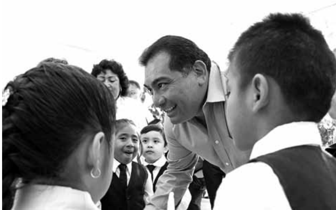
"El futuro vendrá, lo primero es trabajar en lo que te toca y dar buenos resultados".

100% de participación y cumplimiento, y 9 de cada 10 maestros evaluados obtuvieron resultados positivos. Estos indicadores permitieron que nuestra entidad se ubicara como una de las tres a nivel nacional con mejores resultados en este proceso. Los docentes yucatecos cumplieron en cantidad y calidad.