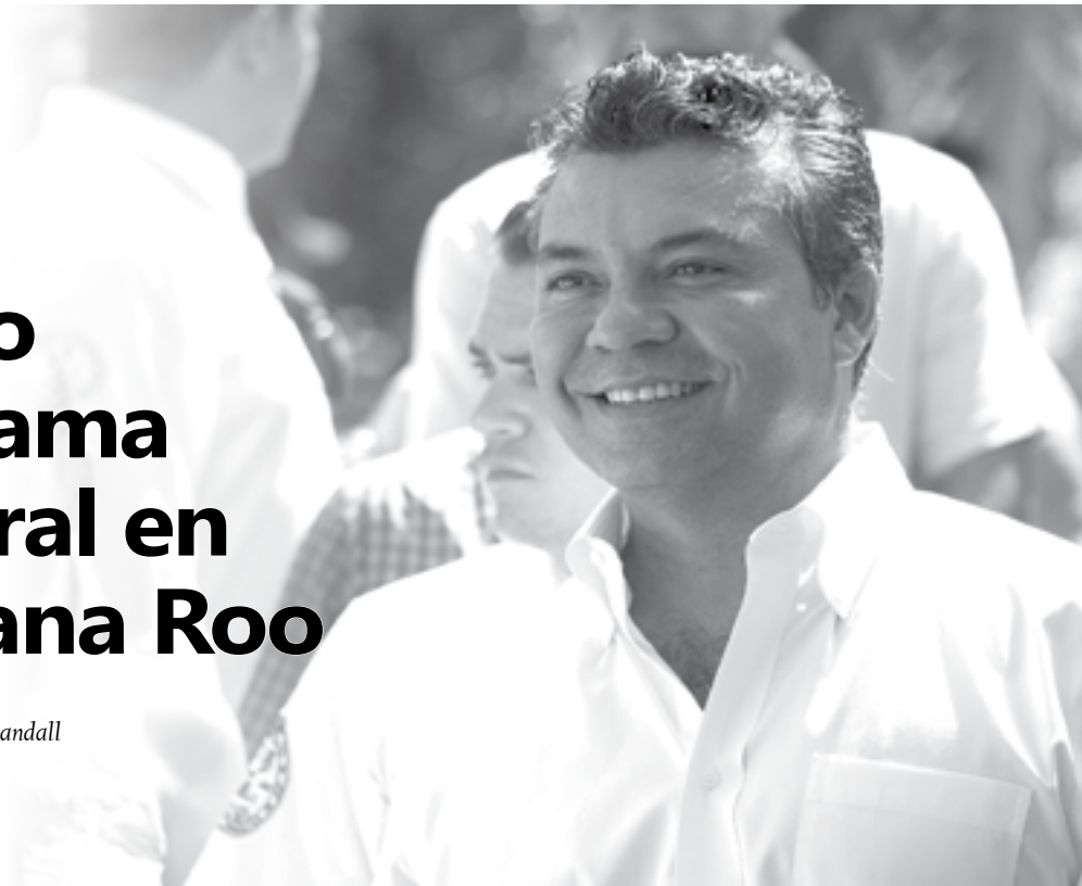
Mauricio Góngora Escalante, candidato del PRI a la gubernatura.

Con el inicio de la campaña política formal en busca del voto ciudadano se da paso a la última etapa del proceso sucesorio por la gubernatura de Quintana Roo, en un escenario que resulta muy interesante, podría decirse incluso que inédito.