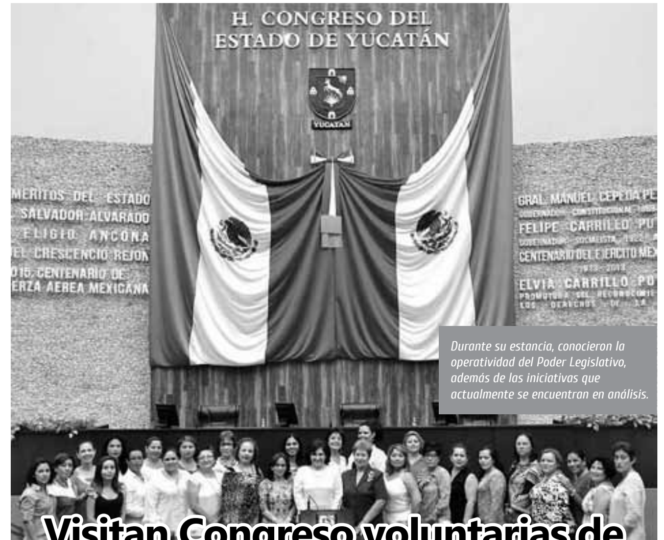
Durante su estancia, conocieron la operatividad del Poder Legislativo, además de las iniciativas que actualmente se encuentran en análisis.