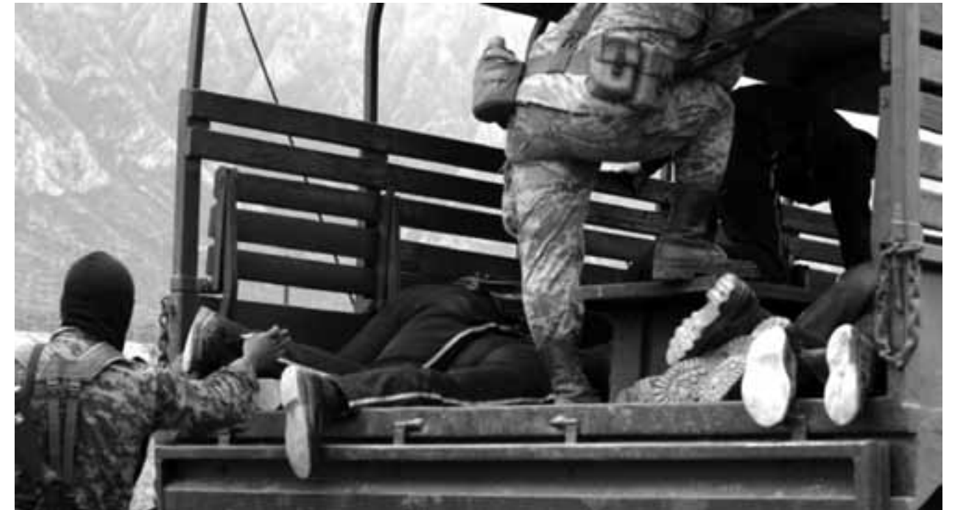
¿Por qué arriesgar imagen e interlocución con el exterior en temas sensibles como derechos humanos o seguridad?