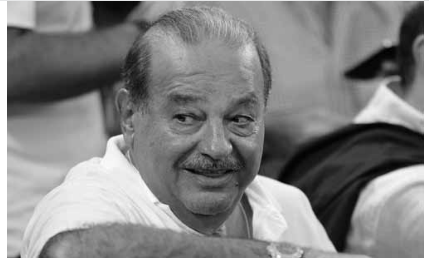
Carlos Slim siempre se lleva bien con los números. Suele tener una calculadora cerca y buena vista (textual, tiene buena vista) para ver los números.

Telmex, no había querido, o podido, entrar a España ni a Europa en general, por ser mercados maduros, con empresas caras que, además, estaban en euros. Sin embargo, la crisis española le dio la oportunidad. Y no la desaprovechó. No es la primera incursión de Slim en España. Ya lo había hecho con Real Oviedo, un equipo de fútbol de segunda división, o también con acercamientos en La Caixa con Inbursa, o con el operador móvil Yoigo, donde apenas comenzó su inversión (tiene el 3%, pero ya lo conoce: ve el negocio, lo analiza y puede dar el zarpazo).