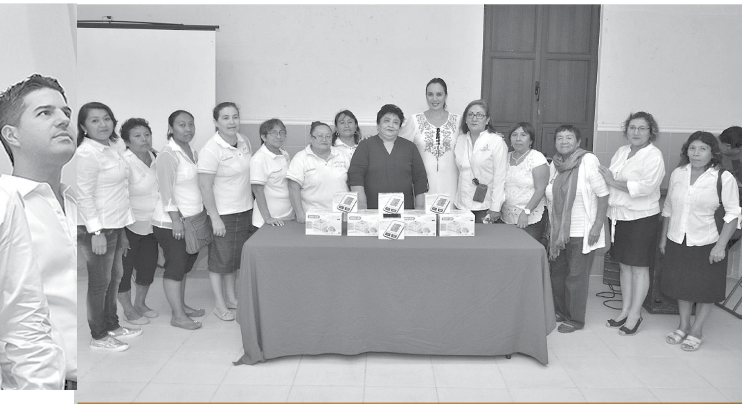
El Grupo de Participación Ciudadana (GPC) de la Secretaría de Planeación (SEPLAN) donó equipo médico y auxiliares para baño a los huéspedes del Hogar de Ancianos "Licda. Dolores Lanz de Echeverría".

sino ciudadanos comprometidos y ejemplares.