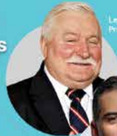
Lech Wałęsa, Premio Nobel de la Paz 1983

+3,500 Asistentes +2,000 Universitarios +27 laureados