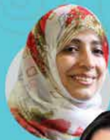
Tawakkol Karman, Premio Nobel de la Paz 2011

50 Líderes de opinión Concierto + Carrera por la paz