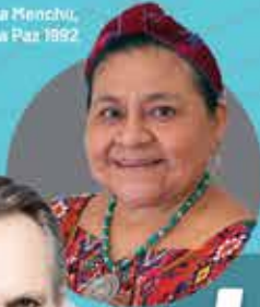
Rigoberta Menchú, Premio Nobel de la Paz 1992

+3,500 Asistentes +2,000 Universitarios +27 laureados