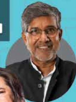
Kailash Satyarthi, Premio Nobel de la Paz 2014

50 Líderes de opinión Concierto + Carrera por la paz