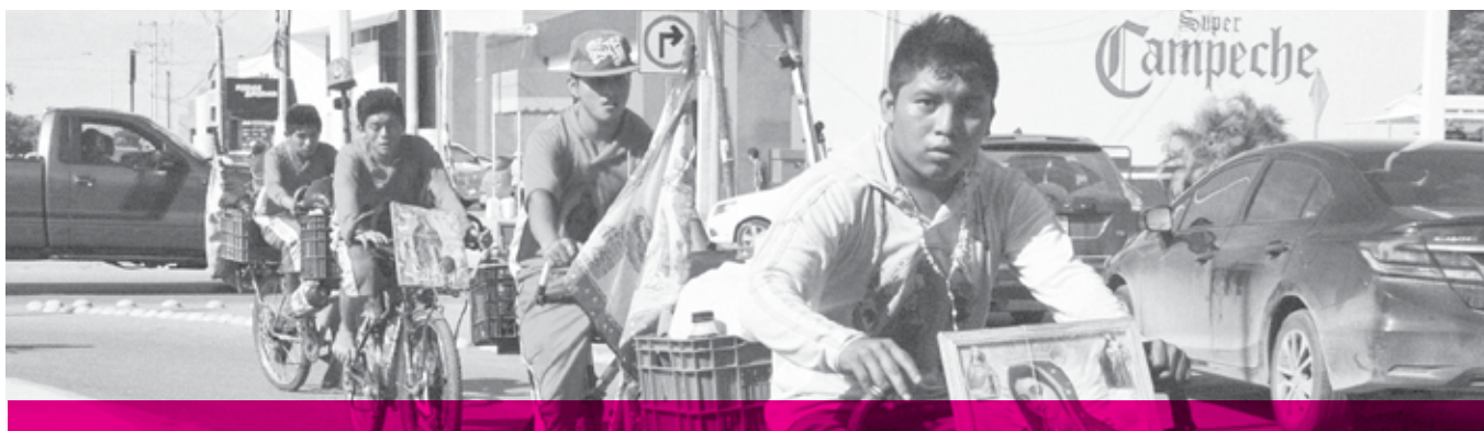
La Seproci exhorta a la ciudadanía en general a tomar precauciones para evitar accidentes durante las peregrinaciones guadalupanas.

los peregrinos; y, en zonas urbanas, tomar precauciones al conducir y ser cortés con los peregrinos.