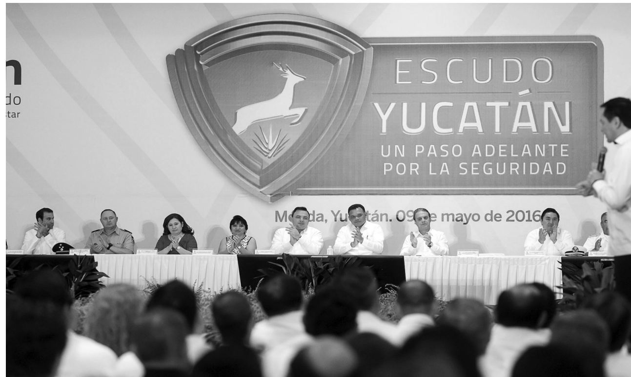
Políticamente no puede pasar desapercibido el respaldo del gobierno federal hacia Rolando Zapata Bello, al anunciar el propio titular de la Segob, Miguel Osorio Chong que Escudo Yucatán podría ser adaptado en otras partes del país como una estrategia nacional en el combate a la inseguridad.