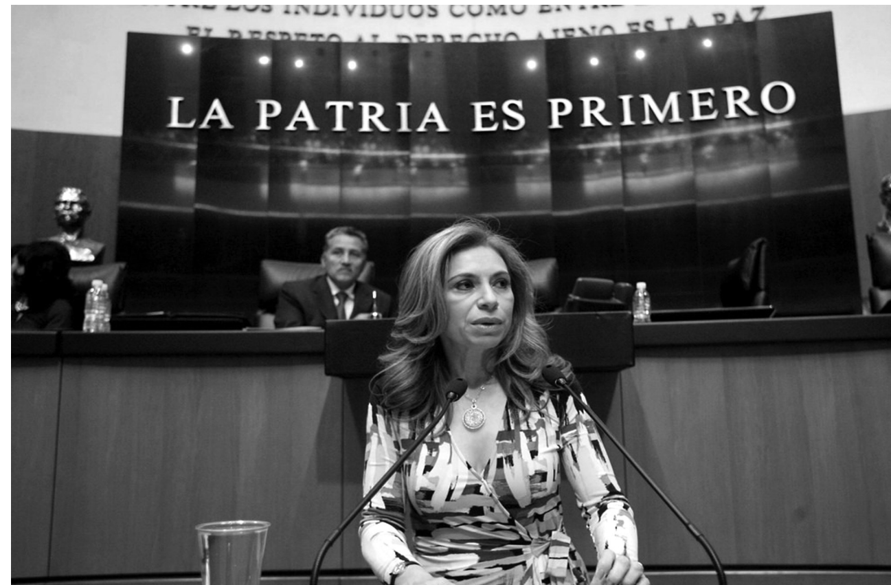
La ex alcaldesa de Mérida ha planteado diversas propuestas y presentado iniciativas de ley ante el Senado, entre ellas, la de los derechos humanos para tener una vivienda digna y las referentes a las penas más severas a la pesca furtiva de pepino de mar.