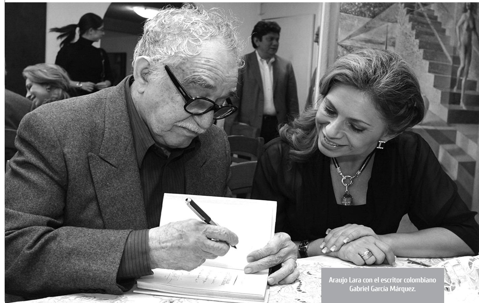
Araujo Lara con el escritor colombiano Gabriel García Márquez.

Alta es el espacio de privilegio que permite crear y fomentar un nuevo marco legal que regule diferentes actividades en el país.