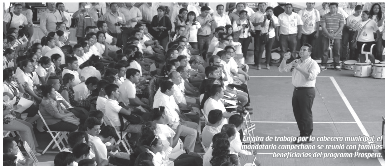
En gira de trabajo por la cabecera municipal, el mandatario campechano se reunió con familias beneficiarias del programa Prospera.