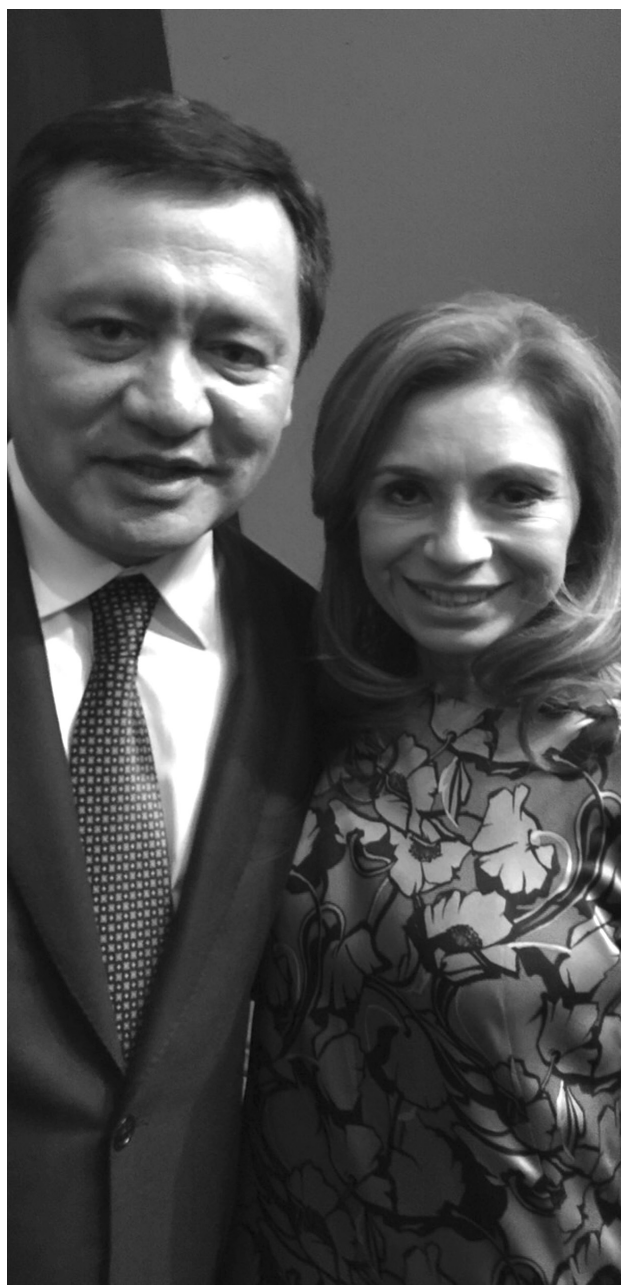
Estoy convencida de la necesidad básica de lograr que cada mexicano pueda disponer de una vivienda adecuada.

"Mis enseñanzas como mujer y madre me hicieron madurar, sé que la política no es una actividad sencilla, que existen muchos obstáculos por superar".