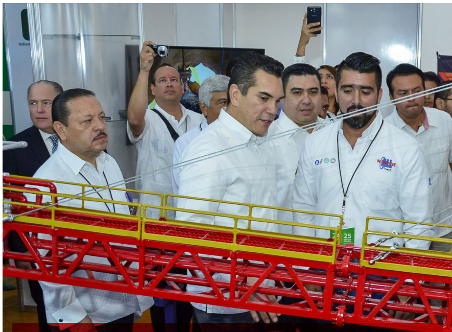
El titular del Ejecutivo recorrió los stands de los empresarios en industriales participantes.