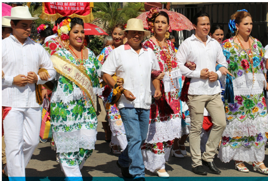
El tradicional convite vallisoletano anuncia festividades de la Candelaria

Este programa prevé brindar a los menores las herramientas necesarias