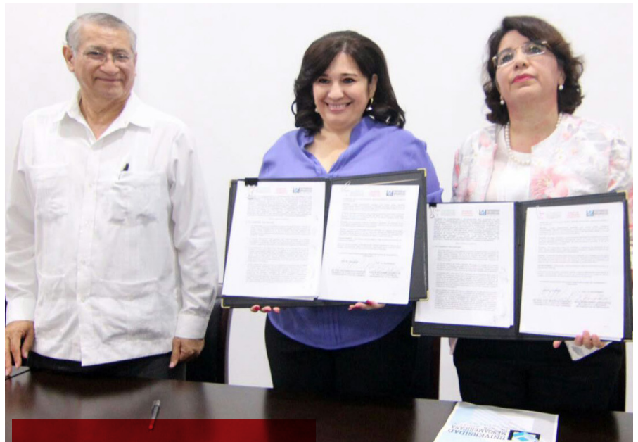
Acuerdo de colaboración.

Destacó que, desde el inicio de su gestión, la LXI Legislatura le ha apostado a la apertura con la sociedad y por ello es importante concretar estos acuerdos con las instituciones educativas, de los cuales ya llevan 16, para mantener y fortalecer la comunicación, sobre