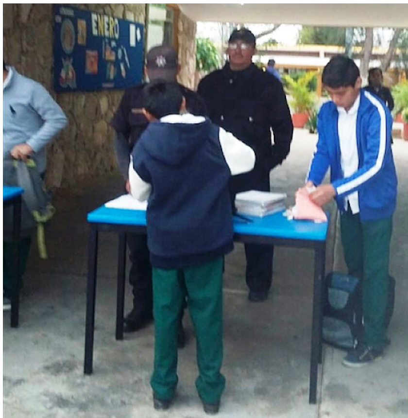
En la Secundaria Técnica 7 de la localidad de Izamal se activó el protocolo de seguridad para realizar "un operativo mochila".

que el "operativo mochila" se implementó bajo el respaldo y con la coordinación de los padres de familia, cuidando respetar los derechos humanos de los menores de edad.