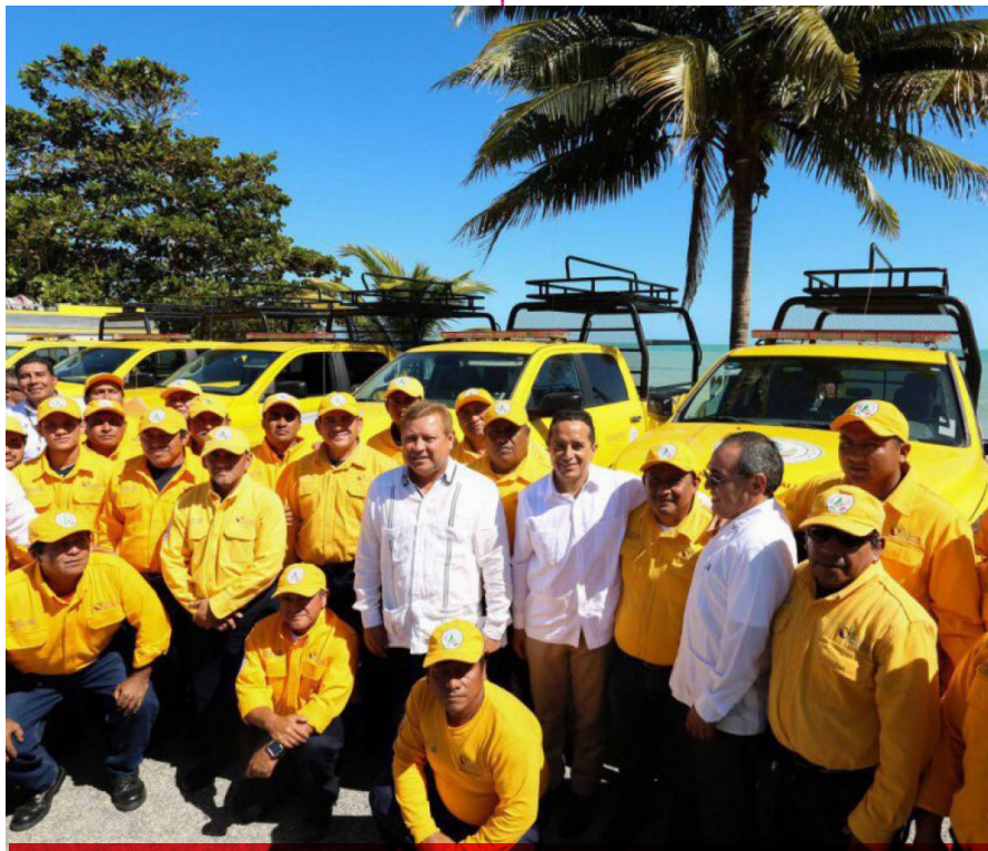
El titular del Ejecutivo estatal tomó protesta a los integrantes del Comité Estatal de Prevención y Control de Incendios Forestales.

"Tenemos que recomponer este gran pacto social entre gobierno y sociedad que fue tan lastimado en los últimos años; reconstruir lo que se usó en beneficio de unos pocos