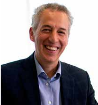
POR JOEL SALAS SUÁREZ Comisionado del INAI @joelsas

El próximo 31 de marzo concluye mi cargo como comisionado del INAI, el cual comenzó en mayo de 2014. Fueron seis años durante los cuales enfoqué mis esfuerzos a impulsar la construcción de un Estado Abierto en nuestro país, ya que los tres órdenes y poderes de gobierno deben atender las demandas ciudadanas. Compartí con un gran equipo esta convicción que se convirtió en nuestra ruta de navegación. Partiendo de ella buscamos que la