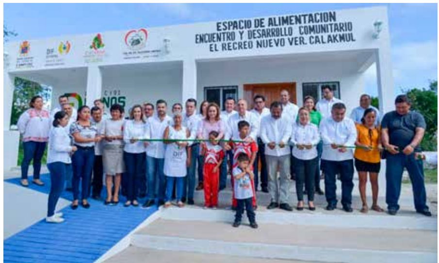
El gobernador Carlos Miguel Aysa González entregó obras de beneficio comunitario, productivo, servicios públicos, de seguridad y salud por un monto de más de siete millones de pesos, en comunidades del municipio de Calakmul.

Aysa González arrancó su gira junto con su esposa, alcaldes y secretarios estatales en el ejido Nuevo Veracruz, donde inauguraron el espacio de alimentación, encuentro y desarrollo El Recreo, que brindará atención a 66 personas entre niños, mujeres embarazadas, personas con discapacidad y adultos mayores. En la obra el gobierno estatal invirtió 866 mil 714 pesos.