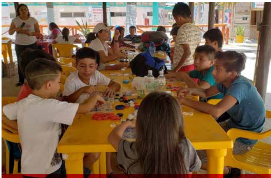
Con la participación de 223 niños de entre 6 y 12 años de edad, la Administración Portuaria Integral de Campeche (APICAM), realiza su Curso de Verano 2018.

Por último, indicó que el Premio de Antigüedad en el Servicio Público, es un reconocimiento que hace la SEDUC