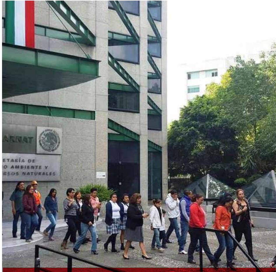
La Secretaría del Medio Ambiente y Recursos Naturales (Semarnat) vendría a Yucatán como parte de la descentralización anunciada por el Presidente electo, Andrés Manuel López Obrador.

Por tanto, no será tan fácil el relevo de personal no más por decreto, además no hay que olvidar que desde hace tres sexenios, en el servicio público federal se aplicó el servicio