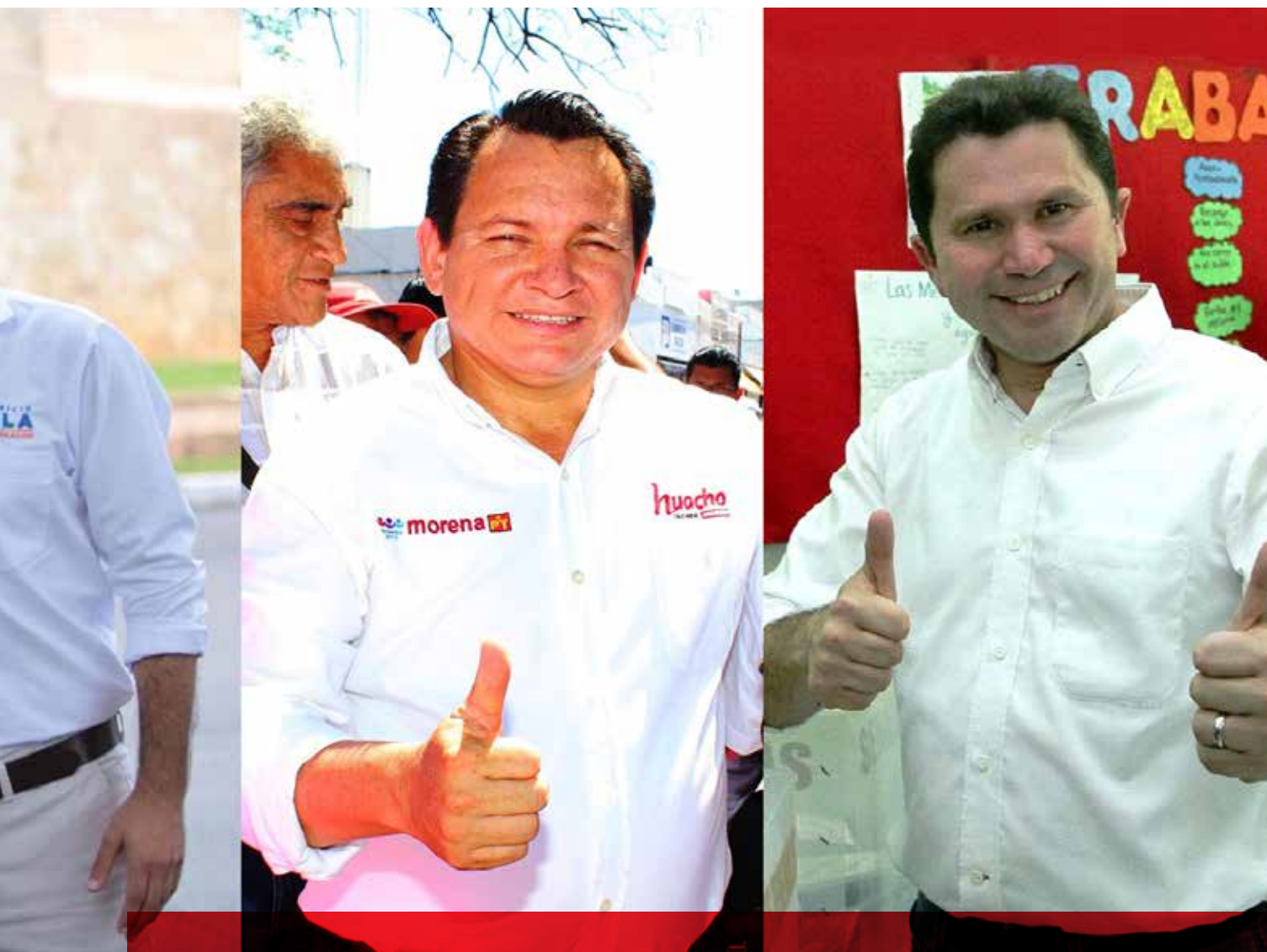
Mauricio Vila, Renán Barrera, Joaquín Díaz Mena y hasta Mauricio Sahuí son actores políticos necesarios e indispensables para el futuro de Yucatán.

y hasta apoyarlo para que sea candidato a gobernador. Así, Renán Barrera se enfrentaría a un doble escenario: no volver a ser candidato a gobernador y volver a ser impedido por una negociación política a tener el futuro político que él desea a pesar de un buen desempeño como alcalde.