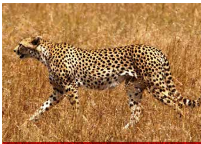
Estudios revelan que solo quedan 7 mil ejemplares del guepardo, el animal terrestre más rápido de la tierra.