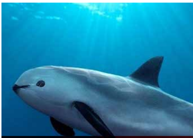
La vaquita de México, la especie más pequeña de marsopas se encuentra en grave riesgo.