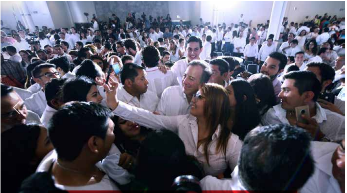
El candidato de la coalición Todos por México a la Presidencia de la República, en un evento en el Club Libanés, se comprometió ante jóvenes yucatecos a estar cerca de la población y a establecer espacios de diálogo.

Finalmente, Meade refrendó su compromiso de encabezar un gobierno de gente decente, "como lo somos la enorme mayoría de los mexicanos, un gobierno en el que el único privilegio, sea ser mexicano". R