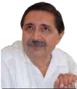
POR ARIEL AVILES MARIN

EN 1950, BUÑUEL PRESENTA AL GRAN PÚBLICO UNA CINTA QUE MARCARÁ UN LUGAR MUY DESTACADO EN EL CINE UNIVERSAL, "LOS OLVIDADOS".