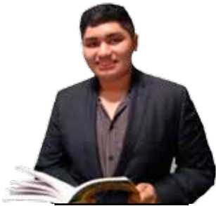
POR ALEJANDRO REJÓN HUICHÍN*

M ientras la pandemia avanza y nos va dejando dudas a todos los que desde nuestra trinchera estamos navegando en este mismo barco, quiero cruzar fronteras, mares y territorios, trayendo para ustedes en esta primera entrega de la columna "Panorama Cultural" a una poeta y crítica literaria española muy interesante que viene haciendo un trabajo distinto al resto de muchos poetas en el mundo, acompañenme a saber más de ella.