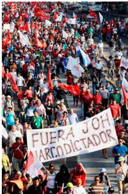
En Honduras miles exigieron la salida de su presidente Juan Orlando Hernández.

- En Honduras también ha habido muchos muertos por protestas, ya que los ciudadanos salieron a las calles a exigir la renuncia de su presidente, Juan Orlando Hernández , ya que se le encontró culpable en Estados Unidos a su hermano de narcotráfico, y hay evidencia que su campaña fue financiada por este negocio. Desde el inicio de su administración, Hernández enfrentó manifestaciones por fraude electoral, y por querer privatizar la