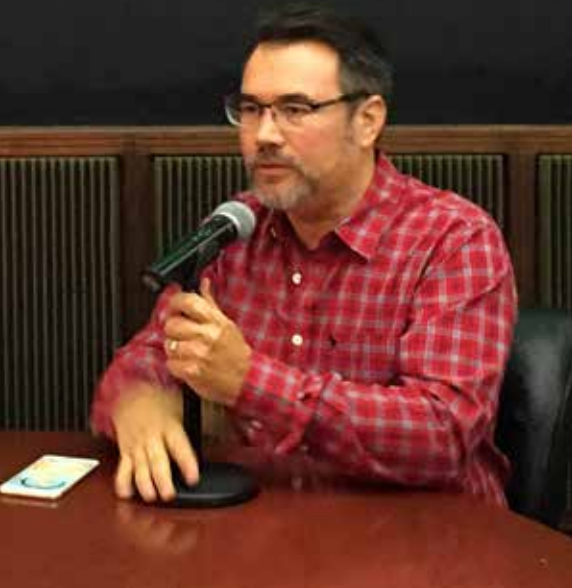
La inversión inmobiliaria privada en vivienda es similar a la que genera la actividad turística, reveló el presidente de la Canadevi-Yucatán.