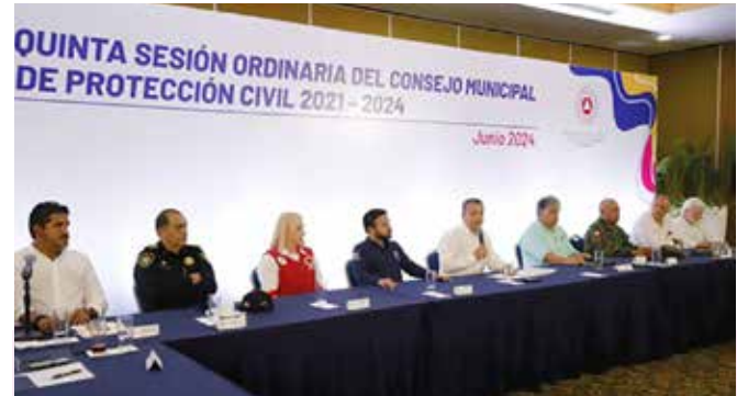
EL ALCALDE ALEJANDRO RUZ CASTRO ENCABEZA LA QUINTA SESIÓN ORDINARIA DEL CONSEJO MUNICIPAL DE PROTECCIÓN CIVIL DE CARA A LA TEMPORADA DE HURACANES 2024.

De igual manera, informó que Protección Civil Municipal también ha impartido 106 cursos con la participación total de 3,675 personas. Además, se impartió el curso Brigada