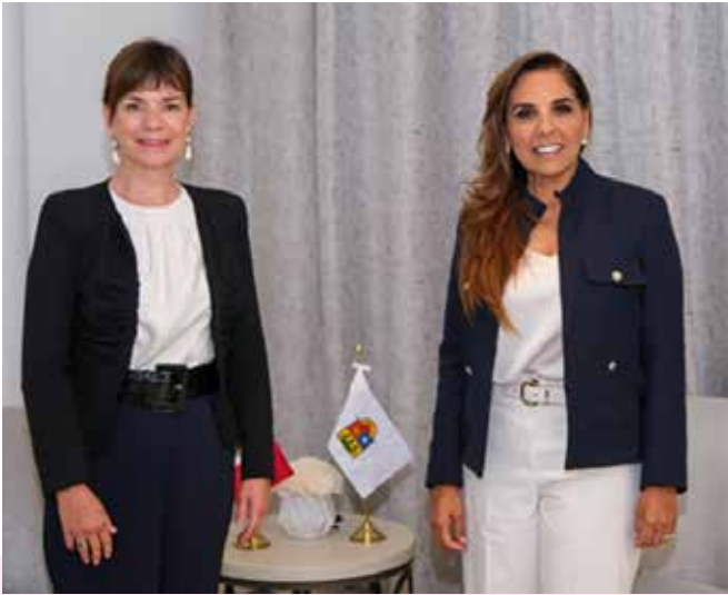
LA GOBERNADORA MARA LEZAMA ESPINOSA SOSTUVO UNA REUNIÓN DE TRABAJO CON LA PRESIDENTA DEL CONSEJO MUNDIAL DE VIAJES Y TURISMO (WTTC) JULIA SIMPSON.

turístico. En 2022, Quintana Roo recibió 19.6 millones de turistas, en 2023 más de 21 millones, y en el primer trimestre de 2024, un incremento del 3.5% con más de 5.4 millones de visitantes, añadió.