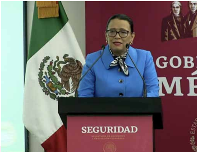
ROSA ICELA RODRÍGUEZ, SECRETARIA DE SEGURIDAD Y PROTECCIÓN CIUDADANA DE MÉXICO.

-¿Cómo creen que impactará esto en la estructura del cártel de Sinaloa y en la lucha contra el narcotráfico? -preguntó la periodista.