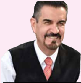
POR FEDERICO BERRUETO

El crecimiento económico es la única salida para resolver la desigualdad y la pobreza, no puede alcanzarse con la visión prevaleciente que descuida el desarrollo y mantenimiento de infraestructura, desalienta la inversión privada, que pretende revivir los monopolios públicos y privados o con la devastación institucional que acaba con la certeza de derechos. La inversión requiere reglas que ofrezcan certidumbre