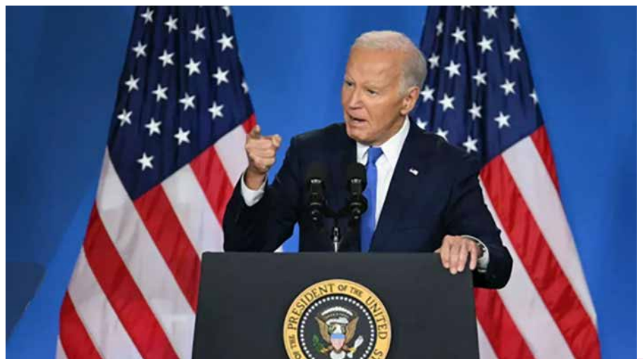
EL PRESIDENTE DE EEUU, JOE BIDEN.