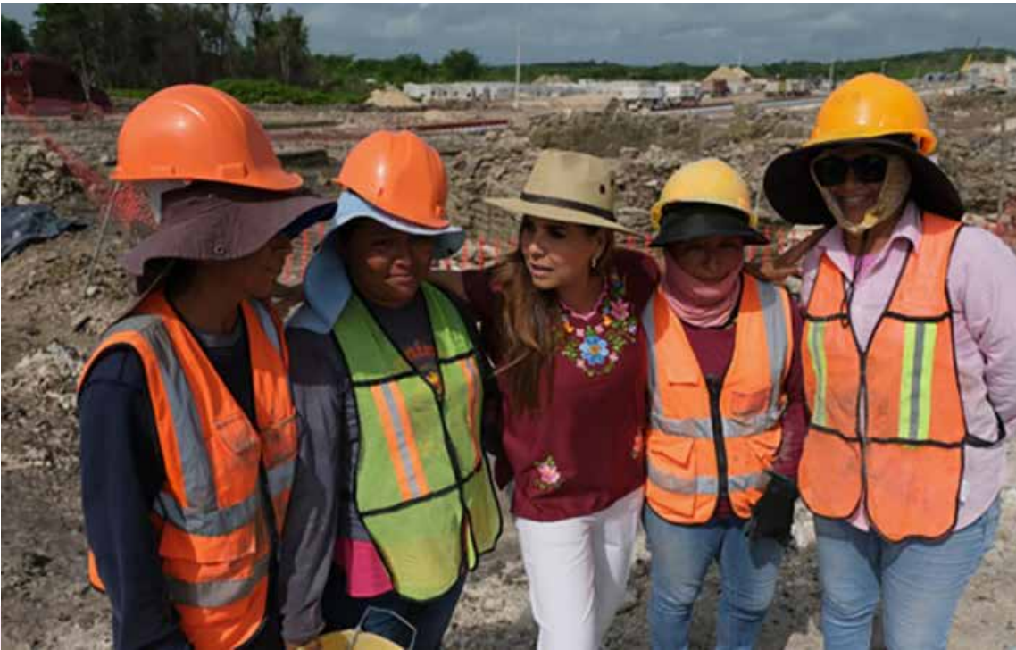
LA GOBERNADORA DE QUINTANA ROO MARA LEZAMA ESPINOSA INFORMÓ SOBRE UN HALLAZGO ARQUEOLÓGICO SIGNIFICATIVO EN LA COMUNIDAD DE NICOLÁS BRAVO, EN OTHÓN P. BLANCO.

para la localización de personas desaparecidas y no localizadas alrededor de todo el Estado.