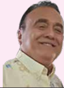
POR ISMAEL MÉNDEZ CAMARGO

La Riviera Maya tuvo una ocupación del noventa por ciento de ocupación en las mencionadas vacaciones y por ende requirió de operarios temporales para cubrir la demanda del turismo nacional e internacional, lo que agravó el traslado del personal, que incluso usaron autobuses propios de los hoteles para coadyuvar a dichos traslados. El proyecto del Tren solo fue un slogan político, pues no ayudó a la economía de los habitantes de este sitio en particular, así como de otros puntos intermedios y mucho menos fue un proyecto social, ya que no se implementaron estrategias de precios accesibles a los pasajeros frecuentes por cuestiones de trabajo, como lo hacen los barcos que cruzan de Cozumel a Playa del Carmen y viceversa, que tienen planes de descuentos para este tipo de