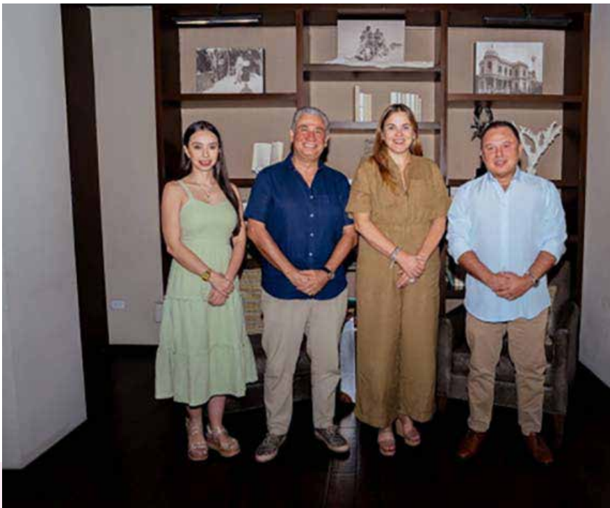
CECILIA PATRÓN LAVIADA, ALCALDESA ELECTA DE MÉRIDA, SOSTUVO UNA REUNIÓN CON REPRESENTANTES DE MICE MEETINGS CONGRESOS Y CONVENCIONES Y LA ASOCIACIÓN MEXICANA DE FRANQUICIAS.