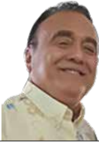
POR ISMAEL MÉNDEZ CAMARGO

Es un lunar negro en pleno Centro Histórico