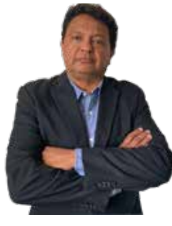
POR FRANCISCO LÓPEZ VARGAS

Poblaciones enteras son amenazadas para colaborar en bloqueos que impidan el paso de fuerzas federales, mientras