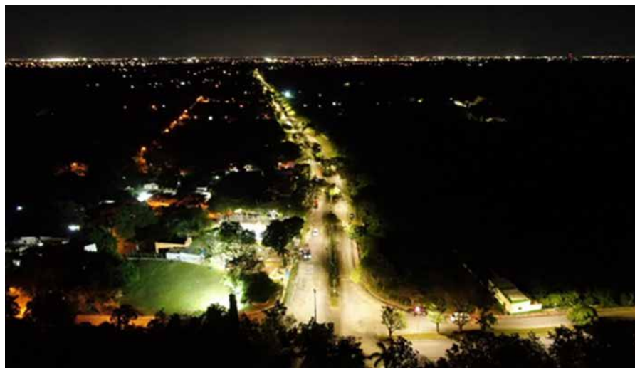
LA PRESIDENTA MUNICIPAL ENCIENDE MÁS DE 200 LÁMPARAS DE TECNOLOGÍA LED EN LA CALLE 50 SUR DESDE LA COMISARÍA DE XMATKUIL HASTA EL PERIFÉRICO.

"Tengan por seguro que desde el primer día hasta el último de mi administración trabajaré 24/7 para darles mejores servicios públicos, pero sobre todo una mejor calidad de vida", concluyó. R