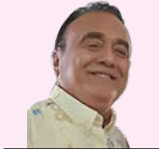
POR ISMAEL MÉNDEZ CAMARGO

La UNESCO en sus resoluciones vía sus observadores, otorgan recursos económicos para apoyar a las ciudades coloniales o con pasado arquitectónico que representan la idiosincrasia de la cultura de cada país, como ha sido en el caso de México, la ciudades de Campeche, Guanajuato, Morelia, Oaxaca, Puebla, Querétaro, San Miguel de Allende, y algunos barrios de la CDMX que se esmeran en conservar sus edificios, templos, parques y calzadas coloniales, que son parte del patrimonio mundial. Obviamente Mérida