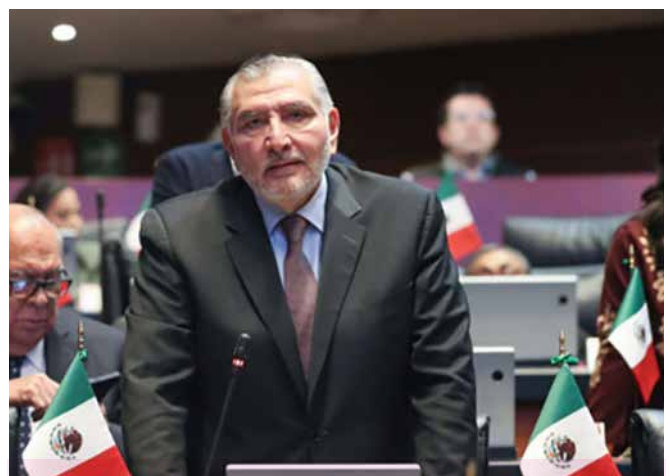
ADÁN AUGUSTO LOPEZ HERNÁNDEZ, SENADOR DE MORENA.