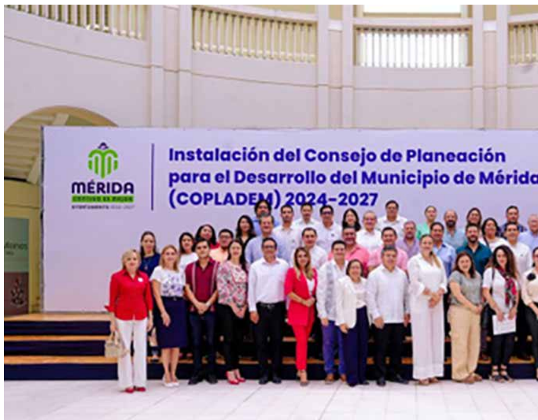
LA PRESIDENTA MUNICIPAL ENCABEZA LA INSTALACIÓN DEL CONSEJO DE PLANEACIÓN PARA EL DESARROLLO DEL MUNICIPIO DE MÉRIDA (COPLADEM) 2024-2027.