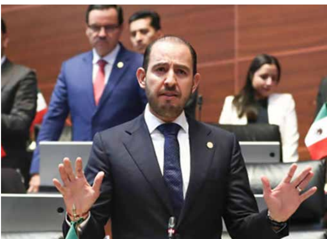
MARKO CORTES, SENADOR DEL PAN.