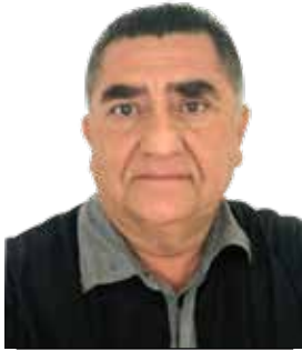
POR MARCO A. CORTEZ NAVARRETE

Lo digo así, textual, con todas sus palabras. No sé ustedes pero creo yo que si algo bueno ha dejado la cuarta transformación es la transparencia en sus gobernantes.