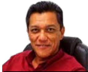
POR JORGE VALLADARES SÁNCHEZ* En Facebook y en Youtube: Dr. Jorge Valladares

Aunque es incorrecto el uso, ayuda a entender el alcance real del concepto de institución cuando se dice de alguien que “es toda una Institución”. Desde luego nadie lo es o ha sido, ya que la definición más cercana a su sentido de fondo es “colección metódica de los principios o elementos de una ciencia, de un arte, etc.”, pero diciéndolo de un decano o experto o persona cuyos méritos son amplios y ejemplo de su ámbito, significan que “así, como él/ella lo hace, es como hay que hacer eso”.