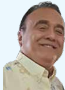
POR ISMAEL MÉNDEZ CAMARGO

El sistema de Salud se cubre con el 11 % del producto interno bruto (PIB). Así mismo me hicieron la observación que los ciudadanos daneses deben cubrir un copago en algunos servicios considerados de bajo costo como son los de fisioterapia, quiropráctica o psicología. Las medicinas básicas son por cuenta de los pacientes, pero existen pólizas para los gastos mencionados de fármacos especiales y para quienes requieran de los servicios colaterales mencionados en la tercera línea de este párrafo. Los derechos de asistencia sanitaria se adquieren con la residencia; en el caso de los extranjeros legalmente viviendo en este país nórdico, podrán acceder a seguros