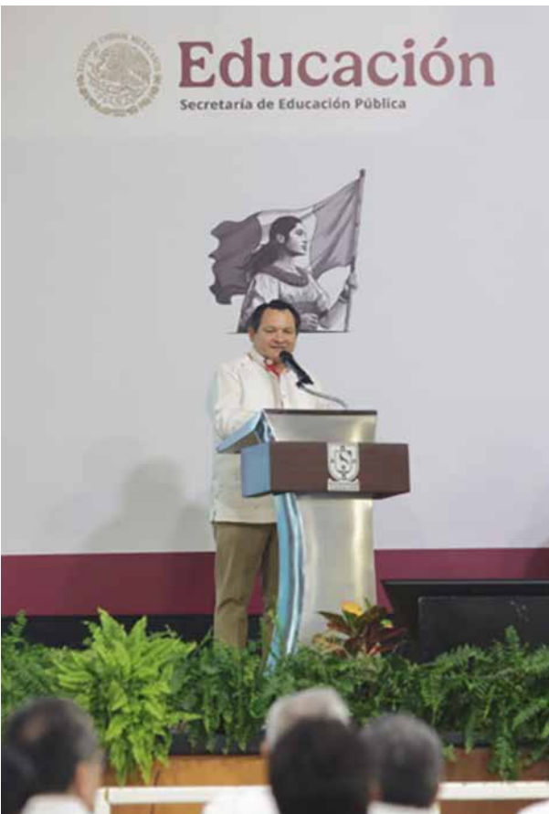
El Gobernador Joaquín Díaz Mena inauguró los Foros Regionales y Consulta para la construcción del anteproyecto de la Ley General de Educación Media Superior en la región sureste.

para la elaboración de políticas públicas que permitan alcanzar una educación con equidad y excelencia.