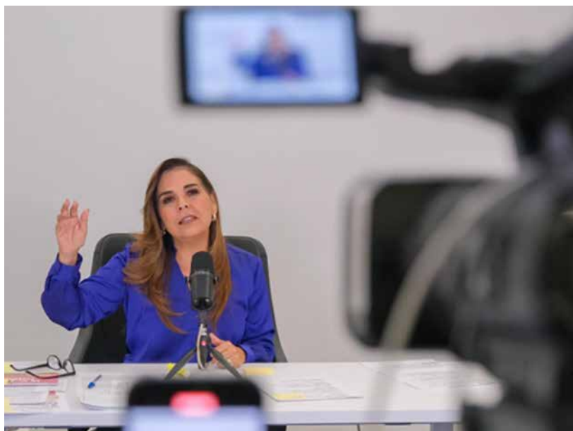
Visibilizamos la violencia contra las mujeres para acabar con ella, con el machismo, el clasismo y el racismo: Mara Lezama.