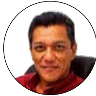
Por: Jorge Valladares Sánchez * En Fb y en Youtube: Dr. Jorge Valladares

Esto lo conocemos bien, no tanto por ese antecedente que ya pocos podemos atestiguar, sino porque, sin tantos aplausos, pero con manifestaciones similares de devoción, lo hemos visto frecuentemente hacia el anterior y la actual persona a la que le dimos el mismo empleo.