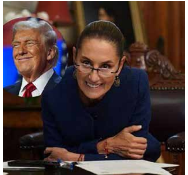
La Presidenta de México confirmó que mantendrá el evento del domingo en el Zócalo,

—En un acto que llamó la atención de México y el mundo, cuando anunció la nueva suspensión de aranceles, Trump volvió a elogiar a Sheinbaum, asegurando que la medida se tomó “por el respeto” que le tiene a la presidenta —comentó la empresaria—. Si bien, no se ignora la difícil situación en la que nos encontramos, es motivo de orgullo ver que la presidenta ha logrado sortear estas crisis con altura y capacidad.