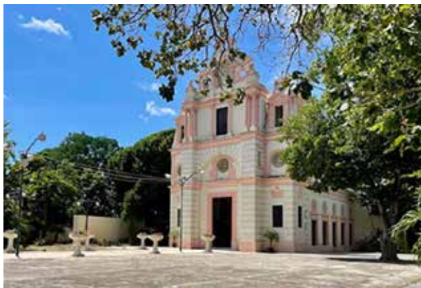
Iglesia de Lourdes, ubicada en la calle 65 esquina con 38 de Mérida.