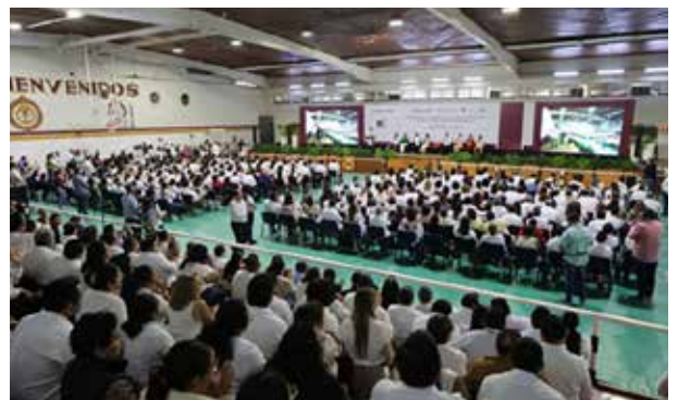
Estuvieron presentes representantes de Yucatán, Campeche, Chiapas, Oaxaca, Quintana Roo, Tabasco y Veracruz.

En ese marco, el Gobernador Joaquín Díaz Mena aprovechó para reconocer a la Presidenta Claudia Sheinbaum, de quien dijo, en momentos complicados para el país ha sabido enfrentar la adversidad con el orgullo de ser mujer y de ser mexicana.