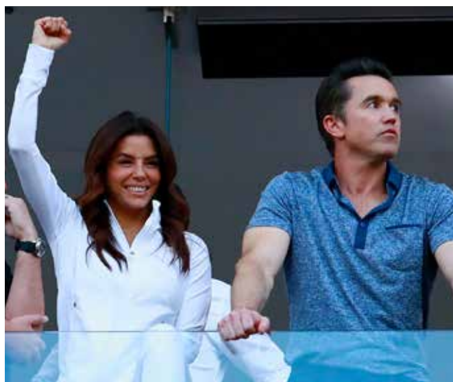
El 7 de agosto se estrenó la nueva serie documental titulada simplemente Necaxa.