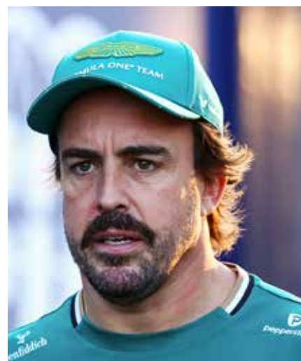
Fernando Alonso, piloto insignia del equipo, se beneficia directamente de esta renovación técnica.

Fernando Alonso, piloto insignia del equipo, se beneficia directamente de esta renovación técnica. Con Cardile a cargo de los aspectos más sensibles del coche, y el insight de Newey en aerodinámica, Aston Martin da un paso decisivo para convertir al asturiano en candidato al campeonato. R