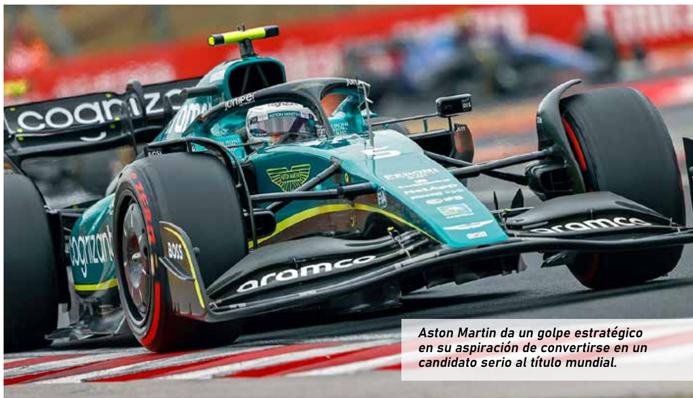
Aston Martin da un golpe estratégico en su aspiración de convertirse en un candidato serio al título mundial.

su incorporación tras superar un litigio legal que lo mantuvo alejado del equipo británico hasta julio. Desde comienzos de agosto, Cardile ha asumido plenamente sus funciones en el AMR Technology Campus, liderando el diseño y la ingeniería del nuevo monoplaza.