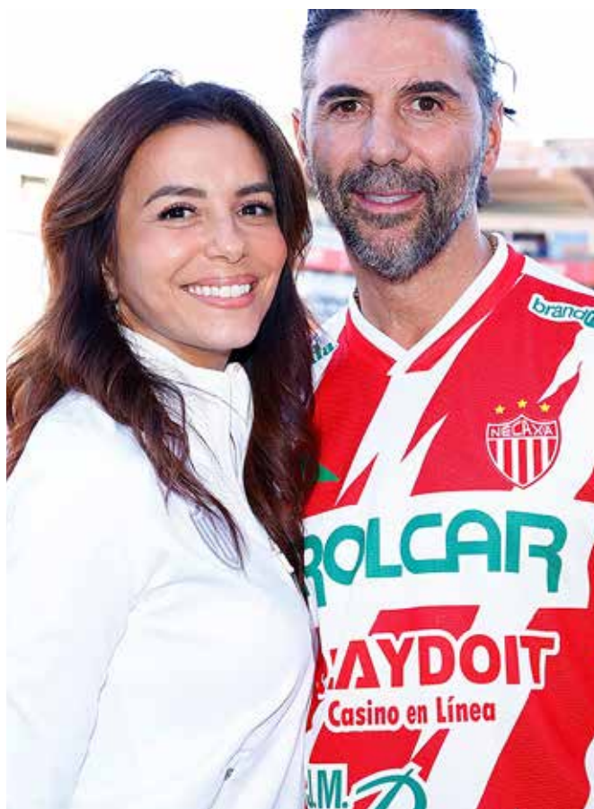
Eva Longoria lidera la narrativa como figura central del proyecto, aportando no solo su imagen, sino una conexión emocional con la cultura latina y el mundo del espectáculo.