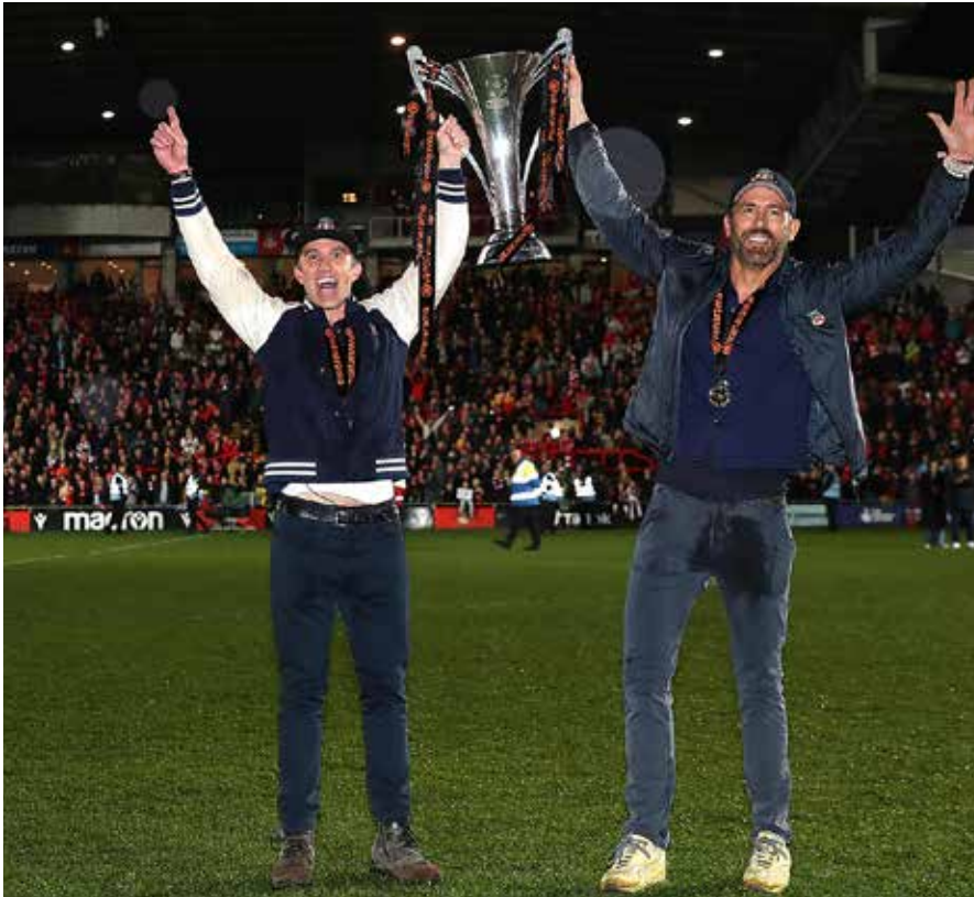
Ryan Reynolds y Rob McElhenney adquirieron al Wrexham AFC y levantaron a una ciudad entera a través de un equipo de fútbol soccer.