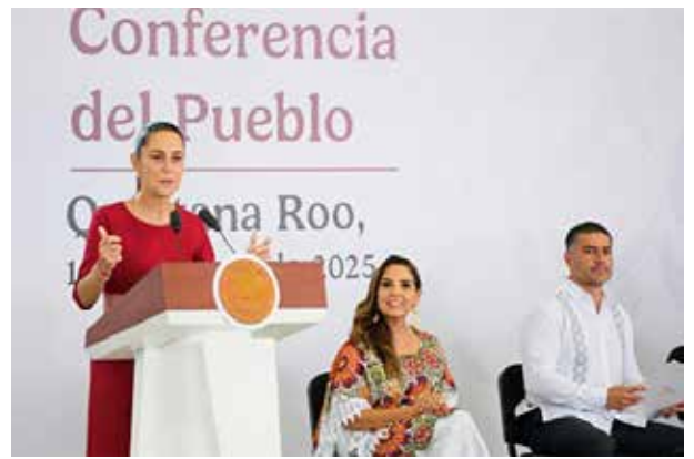
La gobernadora de Quintana Roo destacó en la conferencia de la Presidenta Claudia Sheinbaum crecimiento de la inversión, atención al sargazo y el impulso al turismo.

Explicó que durante el 2024 se registraron 15 nuevos centros de hospedaje con 4 mil 915 nuevas habitaciones. Este año, hasta julio pasado, se han sumado 4 nuevos centros con mil 424 habitaciones, que hacen un total de 6 mil 339 que reflejan la confianza en los gobiernos de la transformación.