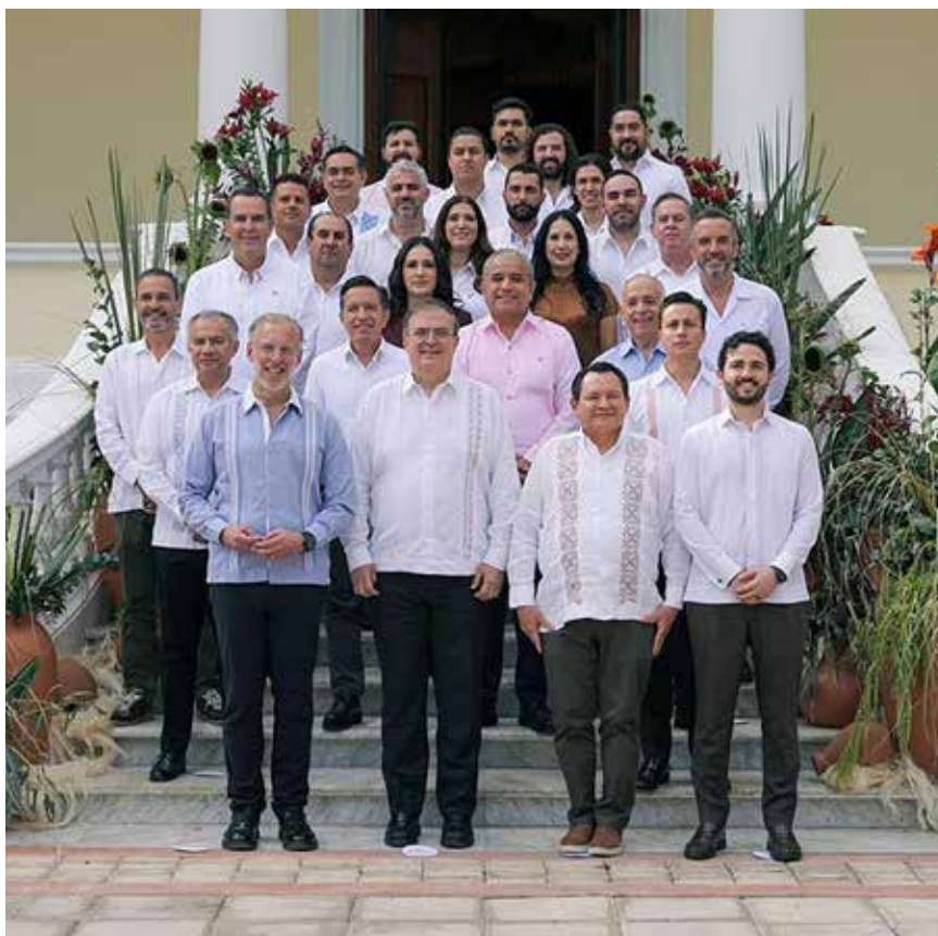
El secretario de Economía y el gobernador encabezaron una reunión de diálogo estratégico entre la Secretaría de Economía y las Secretarías Estatales de Economía y Trabajo, organizada por la Asociación Mexicana de Secretarios de Desarrollo Económico (Amsde).