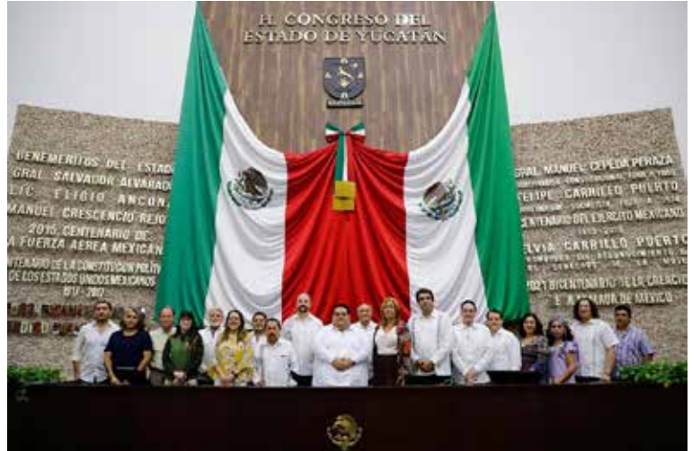
El Congreso del estado fue sede de la Reunión Interinstitucional de Migración en Yucatán.