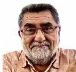
Por Marco Antonio Cortez Navarrete.

Motores, sensores, fricción, incertidumbre... y aun así la robótica avanza, pero de manera más terrenal, más costosa, más lenta. Y es precisamente por eso que la IA se ha vuelto su combustible máspreciado. Hoy la delantera no es de una ni de otra, sino de su unión. La IA es el cerebro; la robótica, el cuerpo.