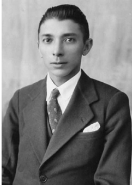
Alfredo Barrera Vázquez, hizo de la antropología un legado histórico y cultural.

N acido en Maxcanú, Yucatán el 26 de noviembre de 1900, Alfredo fue un niño que mostró mucha madurez en todas las etapas de su vida, destacando sobre la mayoría de los niños de su comunidad; siempre se mostró muy interesado en los pueblos originarios de Yucatán y en un ferviente deseo de aprender para compartir con los yucatecos toda la herencia histórica y cultural del pueblo maya. Desde muy joven viajó a Europa con su familia, donde cursó la educación básica, para luego llevar estudios superiores a la Escuela Normal de Maestros de Yucatán, hoy con el nombre de Rodolfo Menéndez de la Peña, posteriormente se traslada a la ciudad de México para estudiar Filosofía y Letras en la UNAM, siendo un alumno muy ameritado, ganándose una beca para estudiar en la Universidad de Tulane.