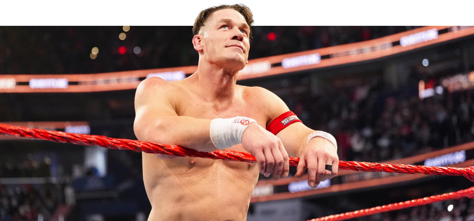
John Cena en su última lucha de su carrera.