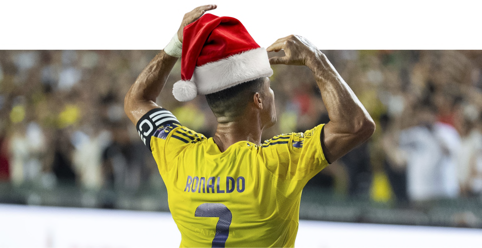
Cristiano Ronaldo marcando y celebrando ante el Al-Ettifaq