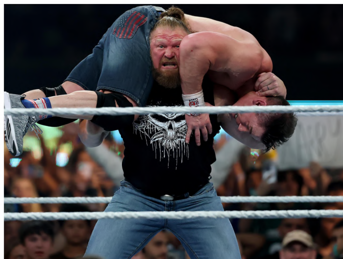
Brock Lesnar aplicándole un F5 a John Cena en su regreso..

Sin embargo, no todo es negativo. De cara a 2026, hay motivos —aunque moderados— para un optimismo cauteloso. Algunos talentos jóvenes ya demostraron que pueden cargar historias importantes si se les da continuidad. Además, la presión por recuperar credibilidad creativa podría obligar a WWE a arriesgar más, refrescar rivalidades y replantear su manera de construir grandes eventos.