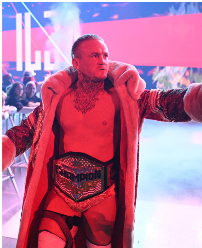
Ilja Dragunov como campeón de los Estados Unidos.

El 2026 no promete milagros, pero sí una oportunidad. Una oportunidad para aprender de un 2025 fallido y volver a hacer lo que WWE mejor sabe hacer cuando se lo propone: contar historias que enganchen, sorprendan y se sientan importantes. Y, por favor, Triple H, si lees esto, refuerza SmackDown, por el amor de Dios. Las tres horas de SmackDown no las va a ver nadie si el show sigue así.