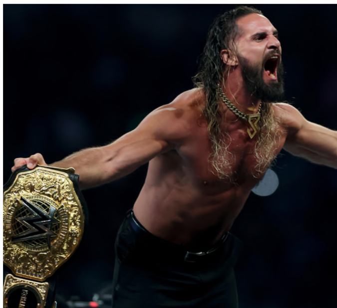
Seth Rollins canjeando su maletín en contra CM Punk.