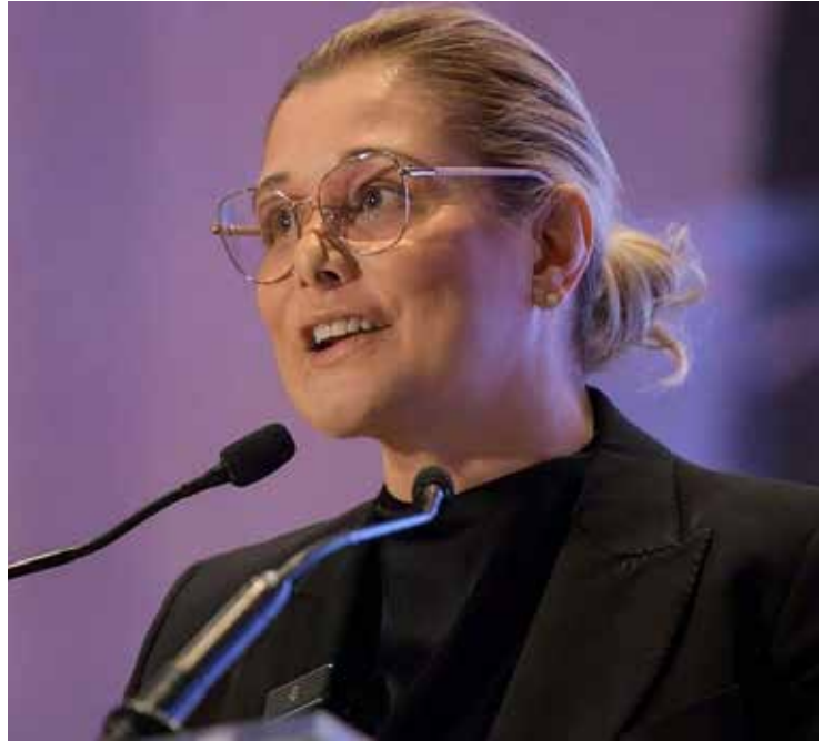
La gobernadora de Chihuahua, Maru Campos.

—Ese tipo de declaraciones son sumamente irresponsables ya que simplifican una realidad compleja y alimentan narrativas intervencionistas que históricamente han sido muy delicadas en la relación bilateral. Es cierto que Trump ha tenido este tipo de arranques en otras ocasiones, pero eso no disminuye la gravedad de lo que plantea —opinó el consultor.