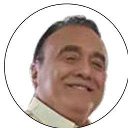
Por Ismael Méndez Camargo

Se ha desmentido la exclusividad masculina en el liderazgo de la rebelión, ya que las mujeres también dirigieron batallones, de igual forma resultaron excelentes espías encubiertas, informando a los rebeldes, de los movimientos de las tropas enemigas, ya sea yucatecas o del ejército federal. El sexo femenino cumplió también tareas esenciales como