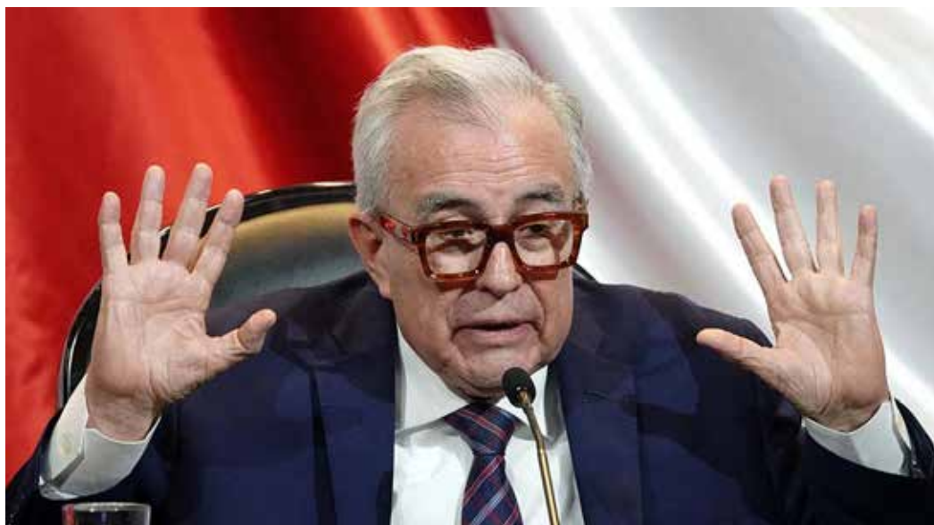
Rubén Rocha Moya, gobernador de Sinaloa.

CDMX.- Las acusaciones que lanzó esta semana el gobierno de Estados Unidos contra funcionarios mexicanos han colocado al país en uno de los momentos más delicados de los últimos años en lo que tiene que ver a combate contra el narcotráfico —advirtió la periodista al iniciar la conversación de esta semana en The Palm de la CDMX—. El Departamento de Justicia señaló directamente al gobernador de Sinaloa, Rubén Rocha Moya , así como a