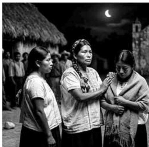
Entre los años de 1847 hasta 1901 las mujeres en Yucatán desempeñaron roles fundamentales en la Guerra de Castas.

enfermeras, cocineras, costureras y parteras para el ejército de los rebeldes. De igual manera un grupo reducido de damas yucatecas propietarias, gestionó la defensa de sus haciendas y propiedades durante el conflicto, a pesar de las restricciones, resultando su participación no solo de apoyo, también de carácter decisivo en los momentos críticos del levantamiento.