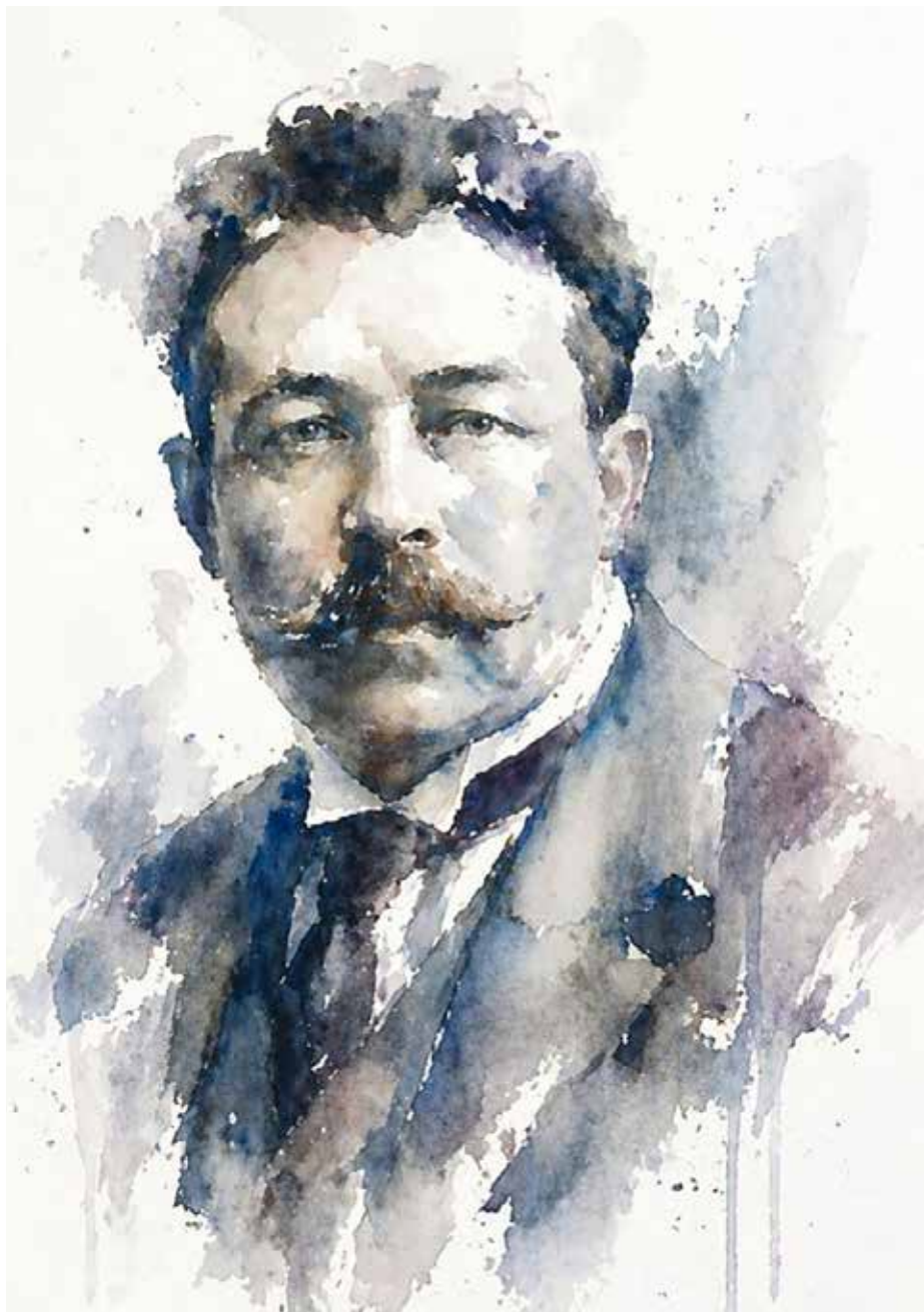
Ilustración Paloma Milla