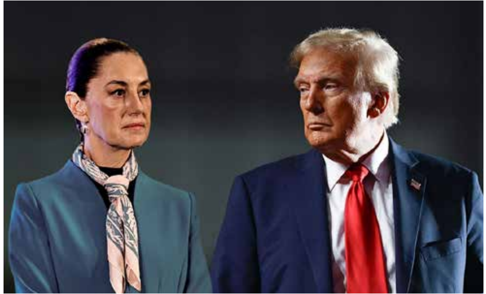
La presidenta de México, Claudia Sheinbaum y Donald Trump, mandatario de EEUU.

La oposición del gobierno de la presidenta Claudia Sheinbaum a que Donald Trump declarara terroristas a los cárteles de crimen organizado tenía como principal preocupación no sólo la aprehensión extraterritorial de los EU a algunos de sus más prominente militantes sino que esa ley también castiga a cualquier persona o entidad que proporcione lo que la ley define como “apoyo material” a estos grupos y se enfrenta a consecuencias severas bajo el estatuto federal 18 U.S.C. emitido como una orden ejecutiva presidencial, equivalente a un decreto.