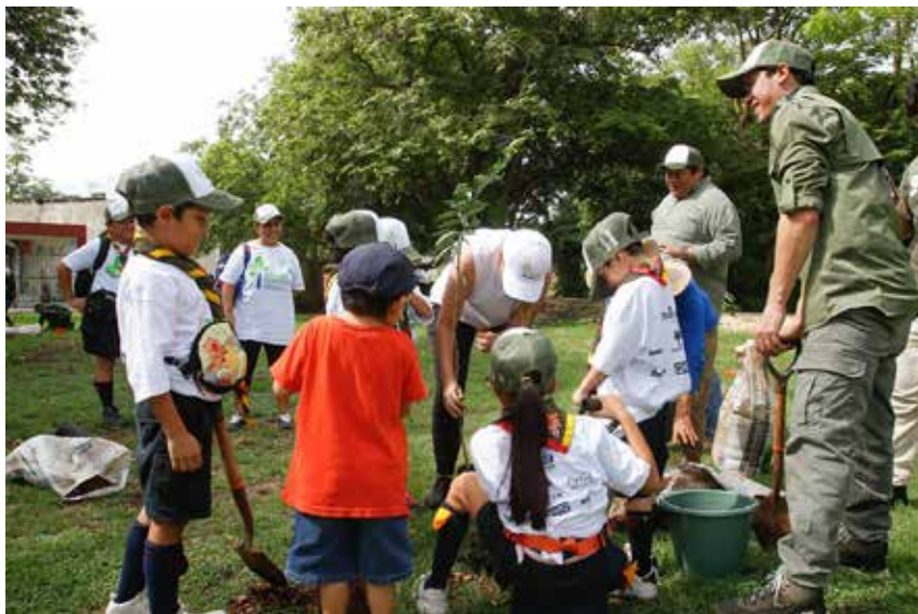
La estrategia busca aprovechar la temporada de lluvias y fortalecer la cobertura arbórea con especies locales.