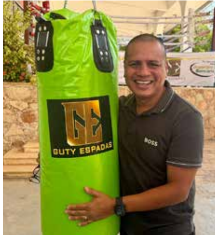
El ex campeón mundial Guty Espadas Jr abrió su Academia de Boxeo en el Centro Deportivo Bancario de Mérida, para socios del club y público en general.

“El objetivo de la academia, que abrimos con el apoyo del Centro Deportivo Bancario, es fomentar el deporte y la práctica del boxeo, preparar a hombres y mujeres de todas las edades, pero, desde luego, también buscaremos formar y entrenar a prospectos para competir en torneos amateur y profesional hasta llegar, ¿por qué no?, a tener un campeón del