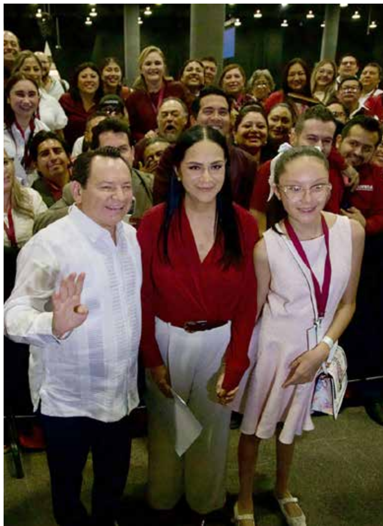
Funcionarios de todos los niveles de Morena asistieron a la toma de protesta de Ariadna Montiel incluyendo los gobernadores de filiación morenista como el de Yucatán, Joaquín Díaz Mena.

La frase que más resonó durante su discurso —“jamás nos van a dividir”— no fue casualidad. Refleja el principal reto que