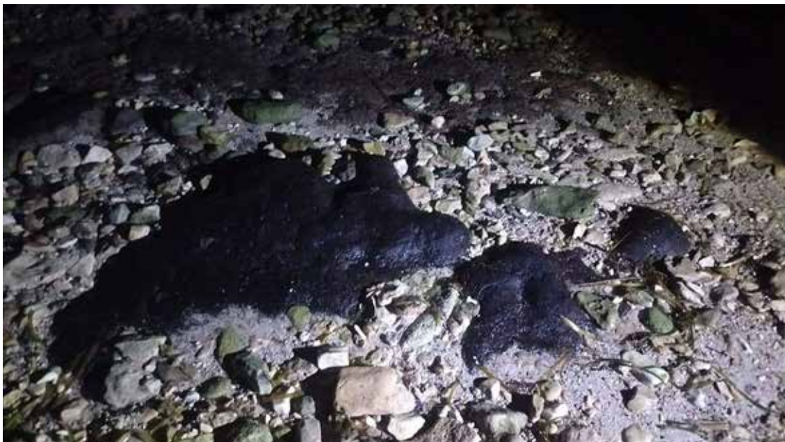
En las rondas de vigilancia de anidación de la tortuga de Carey se detectaron grandes manchones de hidrocarburo fresco en la costa campechana.

E l Consejo Consultivo Tortugueros de Campeche reportó la presencia de manchas de hidrocarburo en las zonas de anidación de tortugas marinas del municipio de Champotón y advirtieron de la posible afectación a estas especies, pues esta es la temporada en que llegan a anidar a las playas.