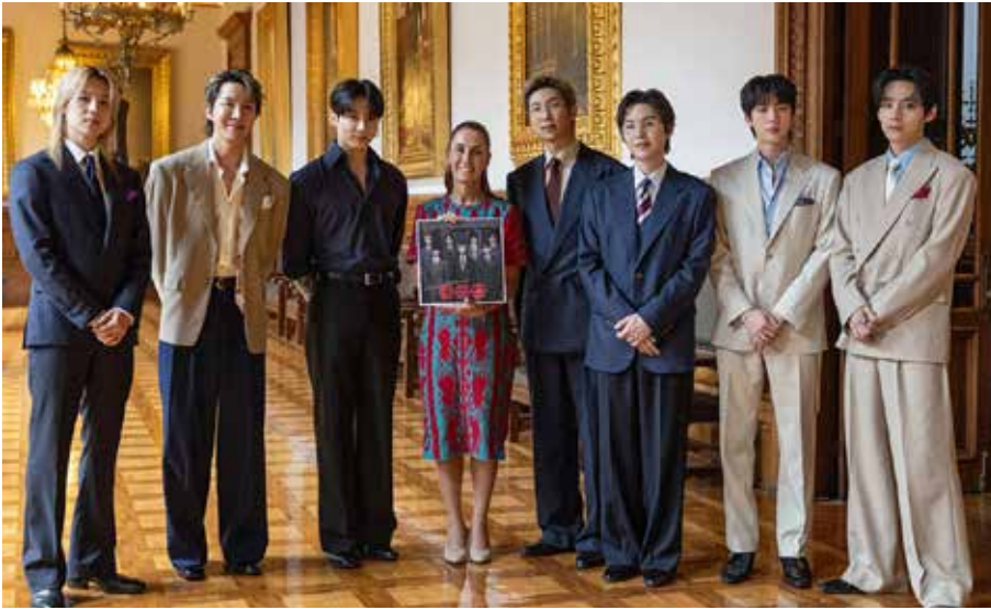
La presidenta Claudia Sheinbaum recibió en Palacio Nacional a la agrupación surcoreana de K-pop BTS.

—Y lo que terminó de encender todavía más el debate fue el cambio de postura del propio Rocha Moya —añadió el editorialista—. En un principio aseguró que no solicitaría licencia y que permanecería al frente del gobierno de Sinaloa, pero apenas unas horas después confirmó que sí dejaría temporalmente el cargo para enfrentar la crisis política y jurídica derivada de las acusaciones.