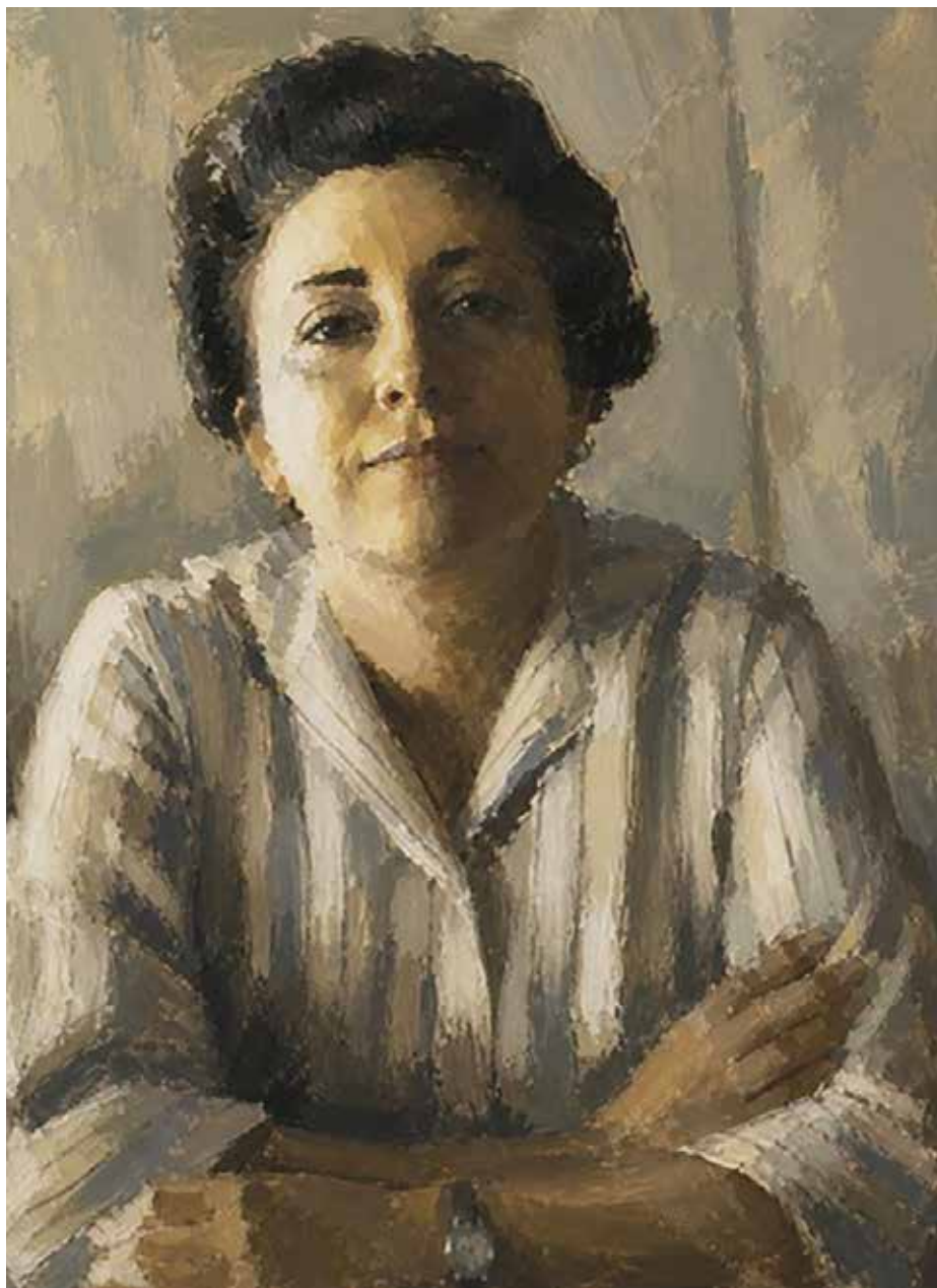
Ilustración Paloma Milla

Durante su conferencia, García Rey expuso que en la novela autobiográfica “Balún Canán”, describe las dos visiones del mundo que descubrió en San Cristóbal de las Casas, siendo ella integrante de una familia cafetalera, privilegiada, mientras la mayoría de los habitantes indígenas estaban destinados a la pobreza, la marginación y al servicio de los blancos. Encontró que la inequidad imperaba también en la relación entre los hombres y las mujeres.