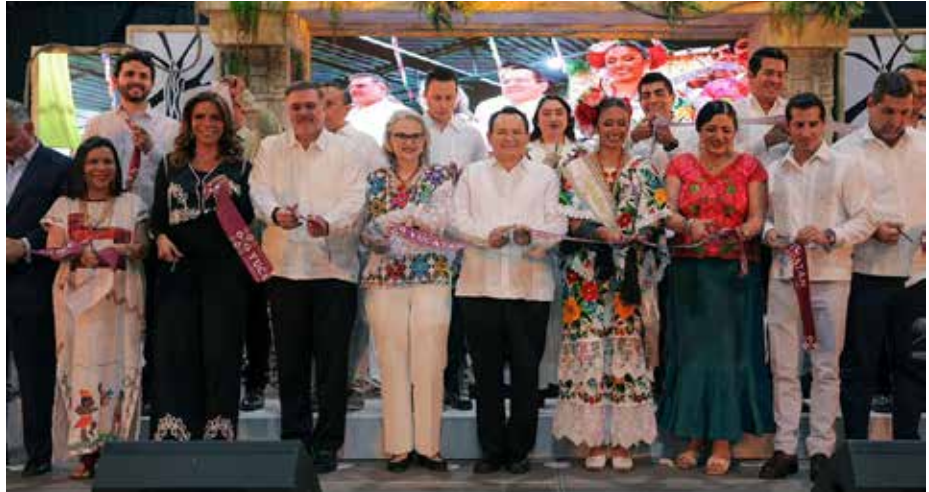
El gobernador Joaquín Díaz Mena, encabezó la inauguración de la Semana de Yucatán en México 2026, que se lleva al cabo en el Palacio de los Deportes de la CDMX, del 8 al 17 de mayo.

En su mensaje destacó la modernización del puerto de altura de Progreso con nuevas plataformas y terminales