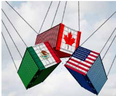
El T-MEC es un acuerdo, no un desafío.

El 1 de julio de 2026 no es solo una fecha en el calendario. Es una cuenta regresiva.