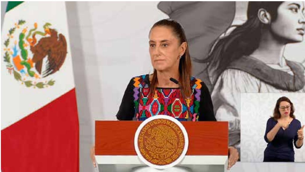
La presidenta Claudia Sheinbaum Pardo.

—Especialmente por la entrevista con Joaquín López-Dóriga —comentó el editorialista—. Hubo un momento particularmente incómodo, casi burdo, cuando quedó en evidencia que la gobernadora aparentemente estaba recibiendo instrucciones o notas de alguien fuera de cámara mientras respondía preguntas delicadas sobre el caso.