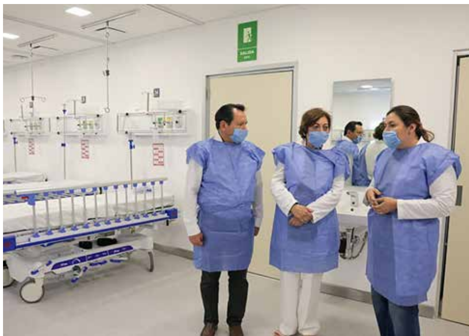
El mandatario estatal se comprometió a seguir recorriendo las áreas del nuevo hospital, para informar a las y los yucatecos sobre el proceso de transición gradual del antiguo al recién inaugurado nosocomio.

“Estamos viendo las áreas que ya están al servicio de los yucatecos. Por la tarde del 20 de mayo comenzó la consulta externa; el jueves 21, los quirófanos entraron en acción, y el 26 de mayo se activa el área de Urgencias”, informó.