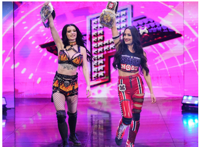
Brie Bella y Paige entrando al ring como campeonas.