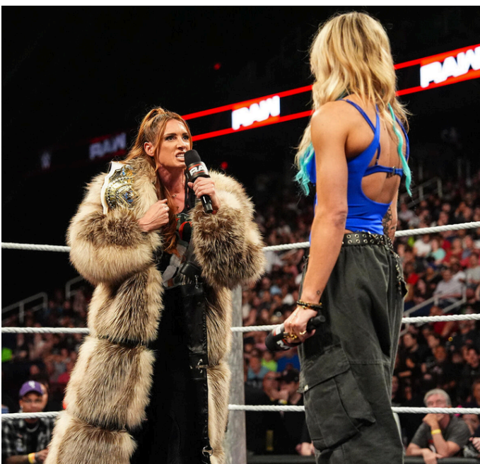
Becky Lynch y Sol Ruca dando una promo.