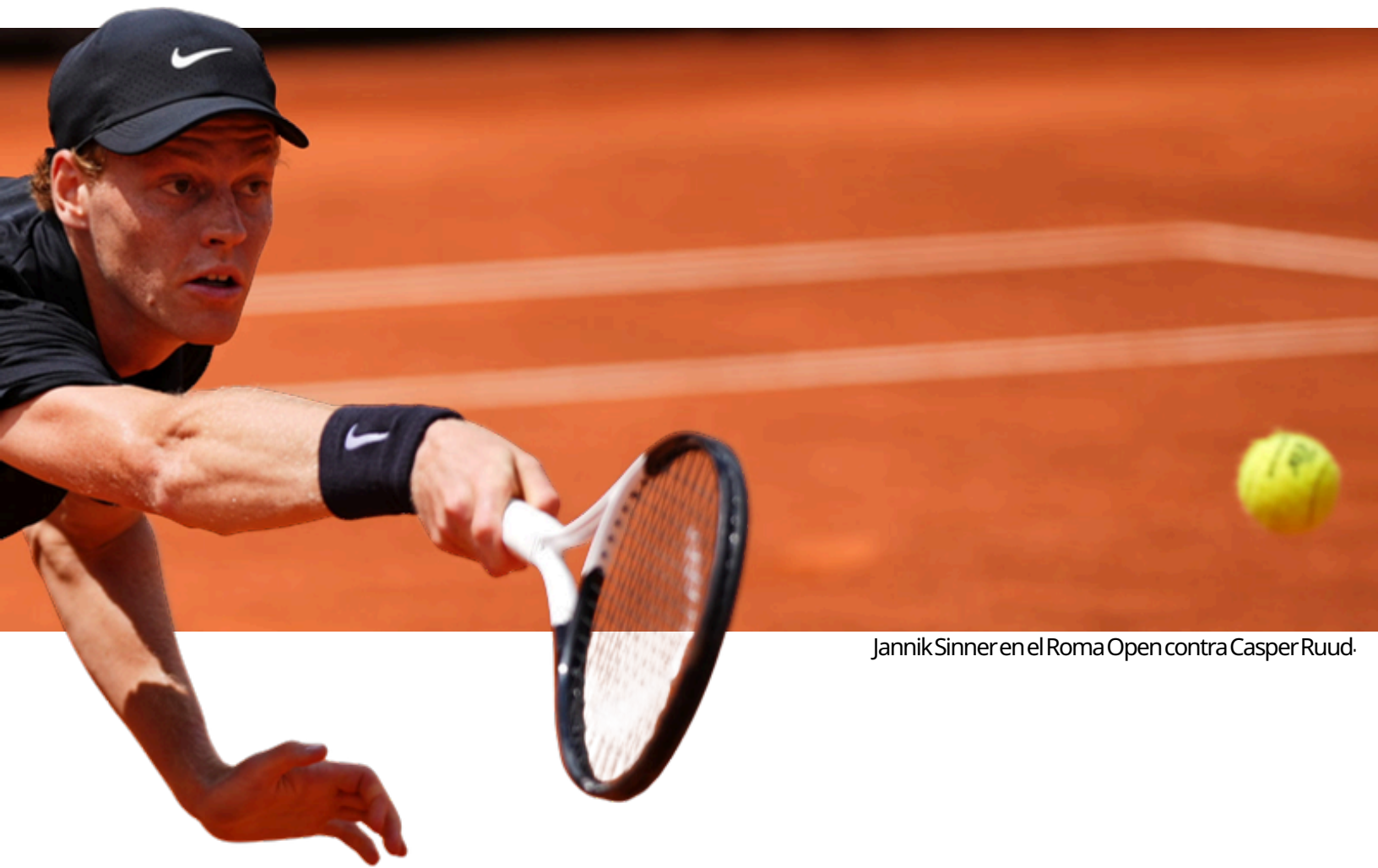
Jannik Sinner en el Roma Open contra Casper Ruud.