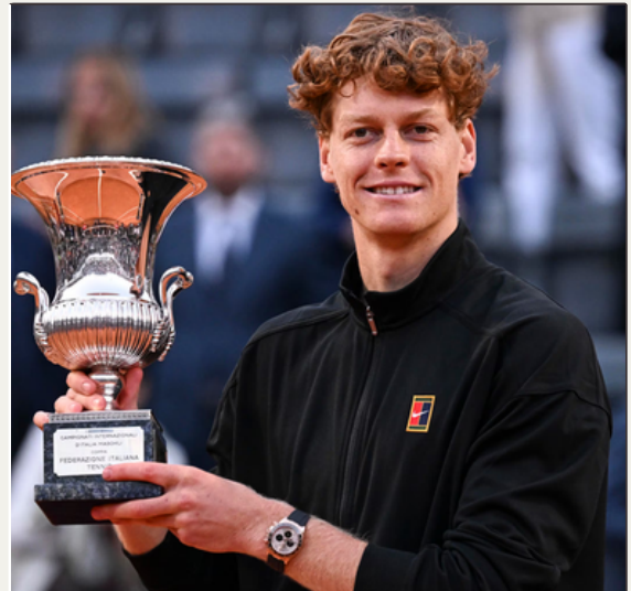
JANNIK SINNER CON EL TROFEO DEL ROMA MASTERS.

Algunos medios incluso especularon con la posibilidad de un ataque de pánico. En ese momento, la lluvia apareció como salvación para el italiano y una fuerte tormenta obligó a suspender el encuentro hasta el día siguiente. Ya más fresco física y mentalmente, Sinner no tardó en cerrar la semifinal y quedar a un solo paso del título. La revancha de Sinner estaba lista. El italiano entró a la cancha con hambre absoluta de victoria y enfrente tenía a un Casper Ruud que poco pudo hacer ante el nivel del número uno. Hubo momentos donde el noruego mostró destellos de gran tenis, pero cada vez que el punto exigía jerarquía, Sinner elevaba su nivel y hacía lo que mejor sabe hacer: ganar. Al final, fue un partido entretenido y de gran calidad, donde Jannik Sinner se impuso 6-4 y 6-4 para proclamarse campeón en su tierra, frente a su gente, en su imperio.