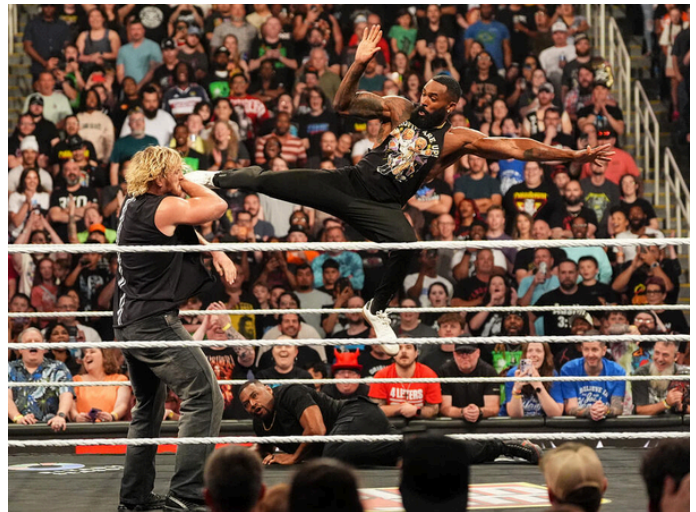
Montes Ford haciendo una patada voladora a Logan Paul.

Por el lado femenino, Brie Bella y Paige unirán fuerzas para enfrentar a The Irresistible Forces por los Campeonatos Femeninos en Pareja. La presencia de Brie Bella y Paige ha generado expectativa entre los fanáticos, principalmente por el impacto mediático que ambas siguen teniendo dentro de WWE. Otra lucha que llama bastante la atención será el enfrentamiento entre Sol Ruca y Becky Lynch por el Campeonato Intercontinental Femenino. Sol Ruca continúa creciendo como una de las jóvenes promesas más interesantes de la división, pero enfrente tendrá a Becky Lynch, una de las luchadoras más importantes y experimentadas de la última década. Finalmente, la cartelera se completa con una lucha de relevos de seis mujeres donde Charlotte Flair, Alexa Bliss y Rhea Ripley enfrentarán a Michin, B-Fab y Jade Cargill. Una lucha cargada de estrellas y personalidades fuertes que podría robarse el show si todas logran conectar dentro del ring. Claramente, este evento no busca ser histórico ni nada por el estilo, pero sí representa una oportunidad para encaminar historias a futuro rumbo a Clash in Paris, Night of Champions y, finalmente, llegar al magnoevento del verano: SummerSlam.