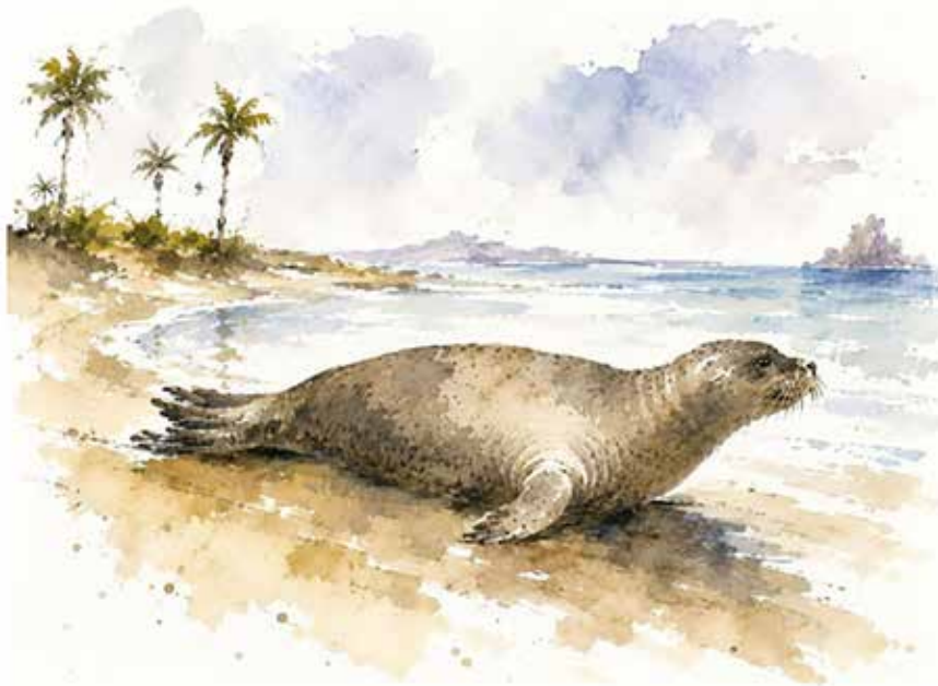
(Ilustración Paloma Milla)

E n las costas de Yucatán habitaban focas con relativa abundancia, hasta fines de los años treinta del siglo XX. Eran las Monachus tropicalis , del orden de los Pinnípedos y de la familia de los Fócidos, correspondientes a un género que habita las aguas tropicales de América, según noticias publicadas por don Alfredo Barrera Vásquez en el Diario del Sureste de 10 de abril de 1942.