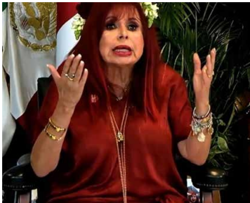
La gobernadora de Campeche, Layda Sansores San Román.