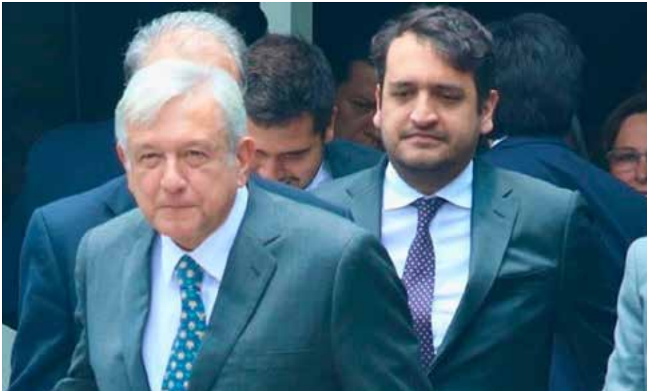
Andrés Manuel López Beltrán junto a su padre.

respaldo a Claudia Sheinbaum , la realidad es que buena parte del texto está dedicado a una reflexión sobre Donald Trump y sobre el deterioro de la relación bilateral entre México y Estados Unidos —observó el editorialista—. Incluso López Obrador reconoce que no le sorprenden las prácticas intervencionistas de Washington porque forman parte de una larga tradición histórica, pero sí expresa sorpresa por el cambio que percibe en Trump respecto al mandatario con quien él convivió durante su sexenio.