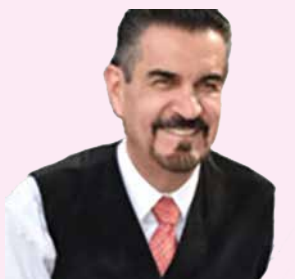
POR FEDERICO BERRUETO

Obligado es pensar en Zacatecas y en los 750 municipios que especialistas y observadores afirman que quien manda es un grupo criminal y no una autoridad civil democráticamente electa.